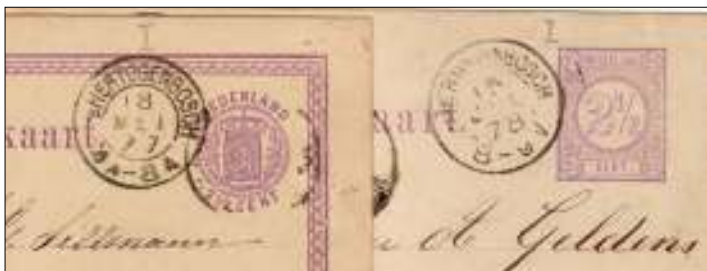
Links: tweeletterstempel 18 mei 1877. Rechts: kleinrondstempel 15 juli 1878.