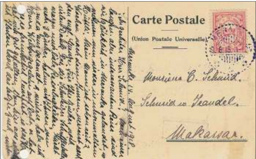
De achterkant van de kaart toont de adressering (Makassar) en haar handgeschreven tekst. De kaart is afgestempeld met het langebalkstempel MERAUKE 19.8.18. Het betreffende stempel is gebruikt vanaf begin 1917.