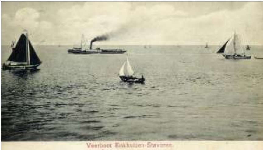
Afb. 1: De eerste stoomrader-veerboot op de Zuiderzee

Een belangrijke schakel in het personen-, goederen- en postverkeer was de veerdienst over de Zuiderzee van Enkhuzen naar Stavoren.