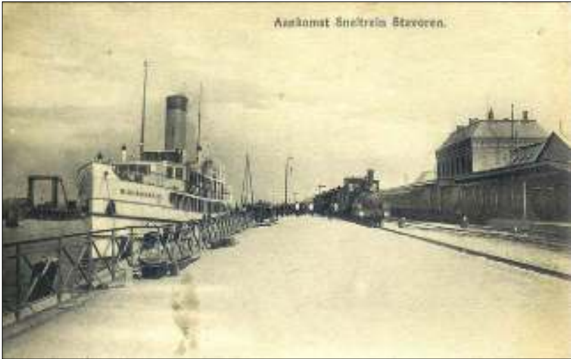
Afb. 6: De aansluitende 'sneltrain' in Stavoren