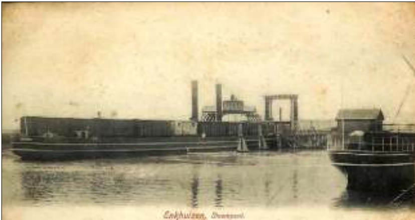
Afb. 5: De vrachtstoompont 'Enkhuiizen'