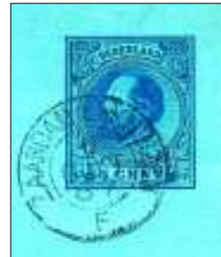
Afb. 2a: Kaart geschreven aan boord van het ss Friesland