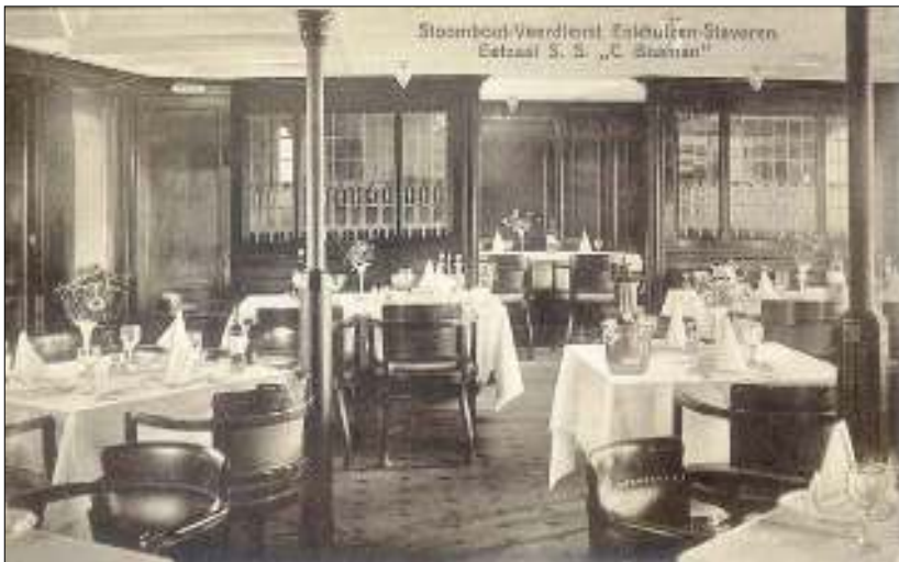
Afb. 7: De eetzaal van het ss 'C. Bosman'

Met het gereedkomen van de afsluitdijk in 1932 nam de concurrentie van het vervoer over de weg toe. De H. IJ. S. M. verloor zijn interesse in de veerdienst en verkocht deze in 1936 aan rederij Koppen uit Amsterdam. Deze zette de exploitatie van de passagiersdienst voort tot ver na de 2 e wereldoorlog.