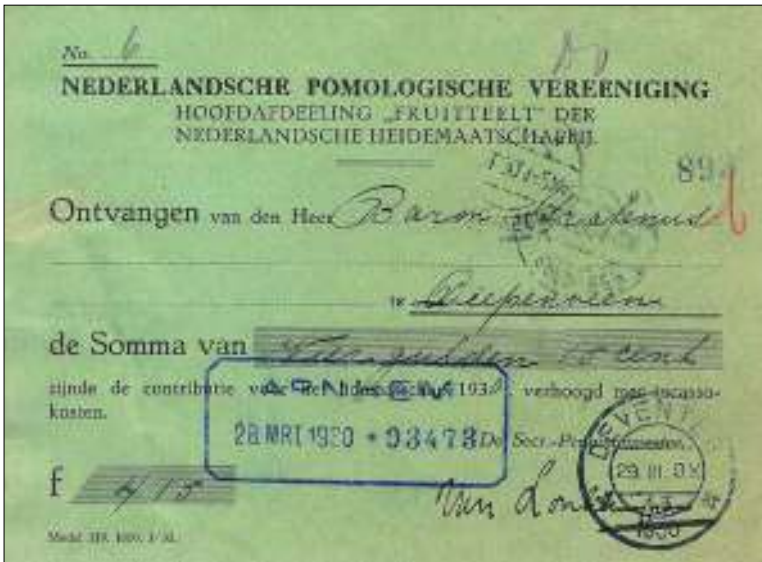
Afb. 2 Lidmaatschapskaart van de Nederlandsche Pomologische Vereniging, 1930

afkomstig uit tropisch Zuid-Amerika. Verder kweekten zij bollen; zij stonden onder meer aan de wieg van een volkomen nieuwe groep van tulpen, de zg. Rembrandt-tulpen. Vandaar dat dit stuk is opgenomen in een hoofdstuk over het sortiment.