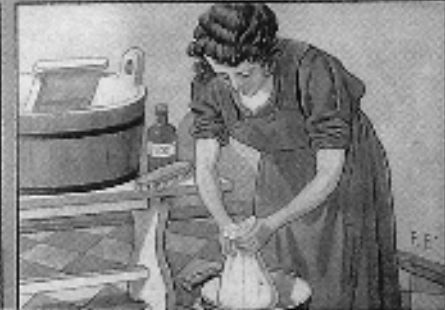
afb. 4 Een affiche uit omstreeks 1910 waarmee de bevolking werd geïnformeerd over maatregelen, ter voorkoming van tbc

volkshuisvesting. De binnenstad was overbevolkt en verkrot. Heel lang nog deed de Dieze dienst als open riool en pas tegen het einde van de 19 e eeuw werd begonnen met de aanleg van een waterleidingnet. Bij elkaar de ideale omstandigheden voor het woekeren van de tering (afb. 4).