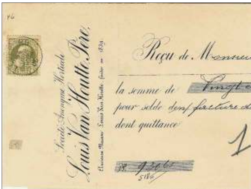
Afb. 1 Kwitantie van S.A. Horticulture Louis van Houtte Père, d.d. 15 juni 1906

Mooi is iets anders, maar de vondst was sensationeel. Op de welbekende beurs in Antwerpen (in het Bouwcentrum, voorjaar en september; ga er eens heen!!!), was ooit een handelaar die in een doos een grote partij “mooie” stukken (documenten) had. Er waren hoofdzakelijk van die geïllustreerde (en wel gefrankeerde) enveloppen van bedrijven in te vinden. Maar ook het afgebeelde stuk (afb. 1), een soort kwitantie die door het postkantoor is behandeld..