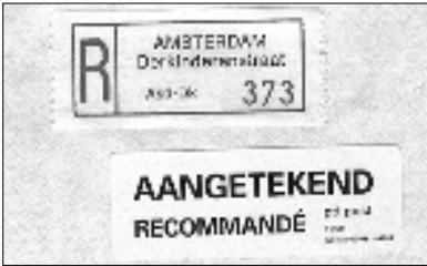
afb. 1 strookje Derkinderenstraat

Al bladerend in een bak met poststukken tijdens een postzegelbeurs viel mijn oog op een envelop die aangetekend was verstuurd vanuit een postkantoor in