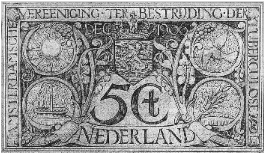
afb. 5 Het ontwerp van A.J. der Kinderen was vervaardigd in potlood en inkt (collectie Rijksprentenkabinet).