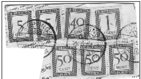
Pakketkaart met stempel Sorong 26-5'52

Het was een belangrijk moment toen hij in de NVPH-catalogus las, dat in het begin van de vijftiger jaren in Nieuw Guinea Nederlandse portzegels zijn gebruikt. Maar dat ging in heel kleine aantallen, meestal slechts enkele honderden exemplaren van elke waarde. Het betreft daarbij niet zozeer strafport, als wel het voldoen van inklaringsrecht op buitenlandse pakketkaarten, doorgaans afkomstig uit Nederland. Die pakketkaarten bleven op het postkantoor, maar zijn later toch mondjesmaat op de markt gekomen. De NVPH