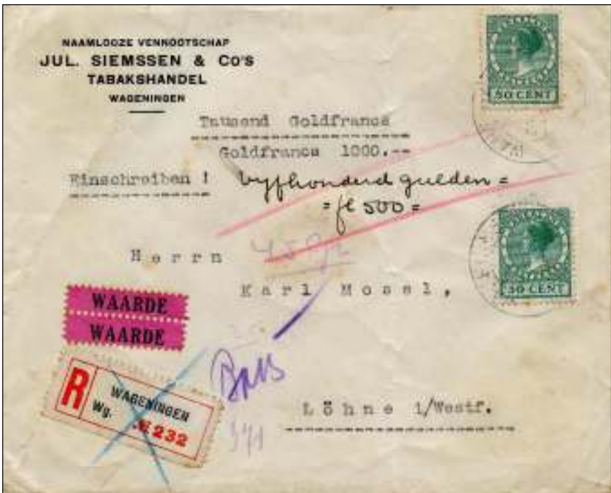
Wageningen, 24 november 1925. Waardebrief met bestemming Löhne, Dtsl. Tarief: brief 41-60 gr.: 35 ct. Aantekenen: 15 ct. Waarde (500 gulden; 10 ct. per 150 gld =) 40 ct. Totaal 90 ct. 10 cent teveel gefrankeerd.