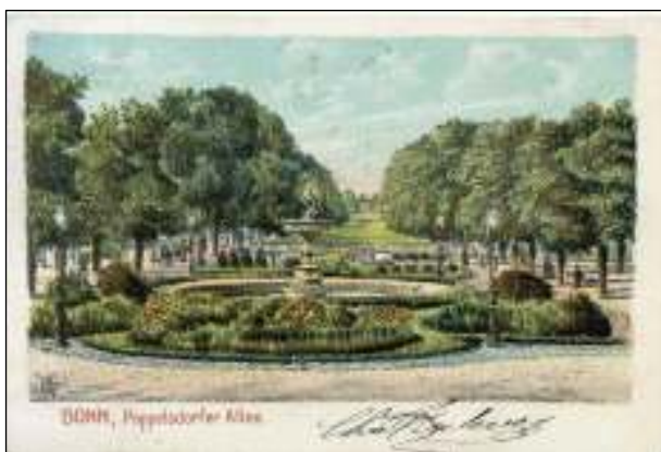
Voorzijde van de prentbriefkaart.

Bonn, 6 augustus 1904. Prentbriefkaart met bestemming Anvers/Oorderen. Omdat de kaart ook aan de voorzijde is beschreven: briefkaarttarief van 10 pfenning. Geplakt slechts 5 pfennig. Strafport in goudcentimes 6\frac{1}{4} ct, in Belgische cts verdubbeld tot 12\frac{1}{2} ct; afgerond op eerste vijftal: 15 ct. Oorderen is een verdwenen Belgisch polderdorp. Het dorp werd in 1965 afgebroken om plaats te maken voor de Antwerpse haven. D. v. d. L.