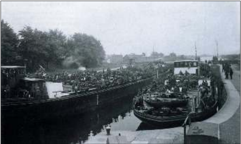
Foto van de volgepakte Rhenus 127 in mei 1940 bij de sluis van Wemeldinge (kanaal door Zuid-Beveland) 1 .

Op deze Rhenus 127 bevonden zich – zo werd achteraf geschat – zo'n 1.200 krijgsgevangen soldaten, zowel boven- als benedendeks.