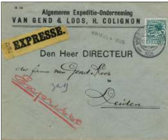
's-Hertogenbosch, 23 mei 1925. Brief per expresse met bestemming Leiden. Tarief: brief tot 20 gr 10 ct.. Expresrecht 40 ct. De brief is in de bus gegooid (zie stempel BRIEVENBUS). Dit gold als excuus voor een eventuele vertraging wanneer de bus tevoren was geleegd.