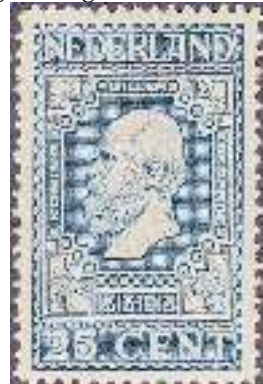
Koning Willem III