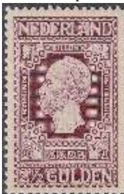
Koning Willem II