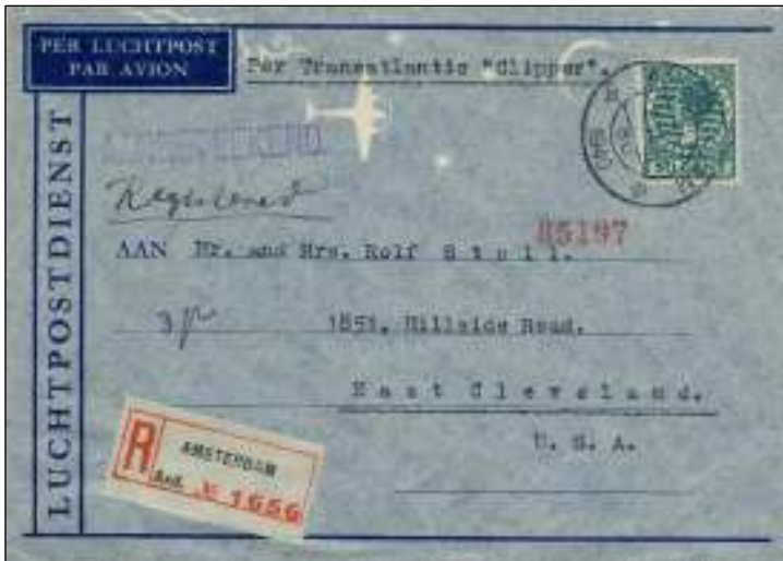
Amsterdam, 3 februari 1940. LP-brief, per 'Clipper' met bestemming Cleveland, USA. Tarief: brief tot 20 gr. 12½ ct. Luchtrecht 27½ ct. Aantekerecht 10 ct. Totaal 50 ct. Vanwege winterweer omgeleid naar Baltimore. Aankomst in Cleveland pas op 1.4.1940. (Vlucht FAM 18)