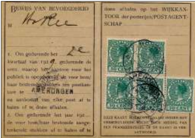
Amerongen, 5 april 1929. Postbuskaartje voor het tweede kwartaal van 1929. Tarief: 2,50 gulden voor de groep 'overige kantoren'.