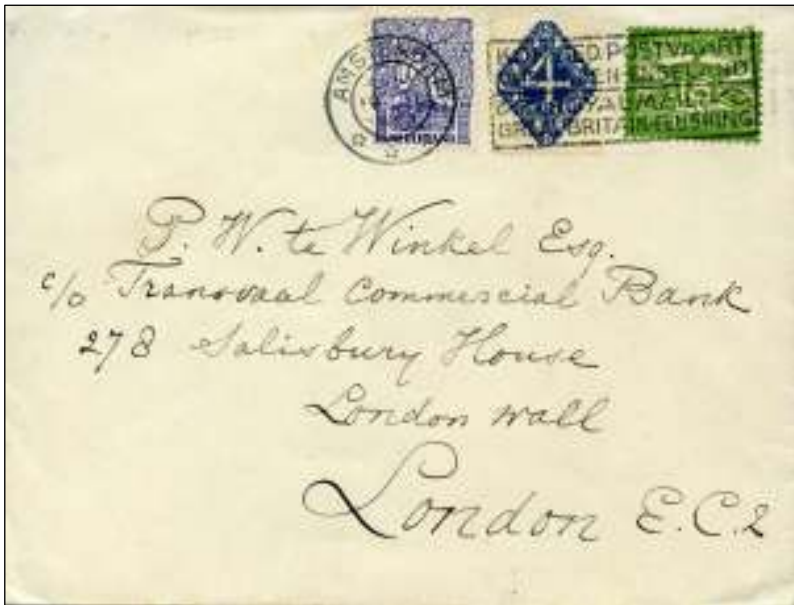
Amsterdam, 19 maart 1923. Brief met bestemming Londen, Engeland. Tarief: brief tot 20 gram 20 cent. Mengfrankering.