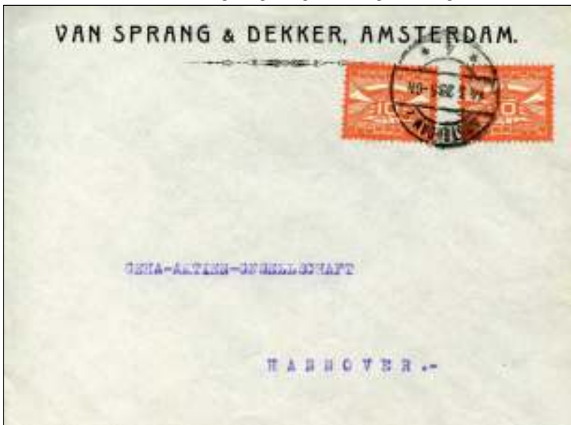
Amsterdam, 14 maart 1923. Brief met bestemming Hannover, Duitsland. Tarief: brief tot 20 gram 20 cent.