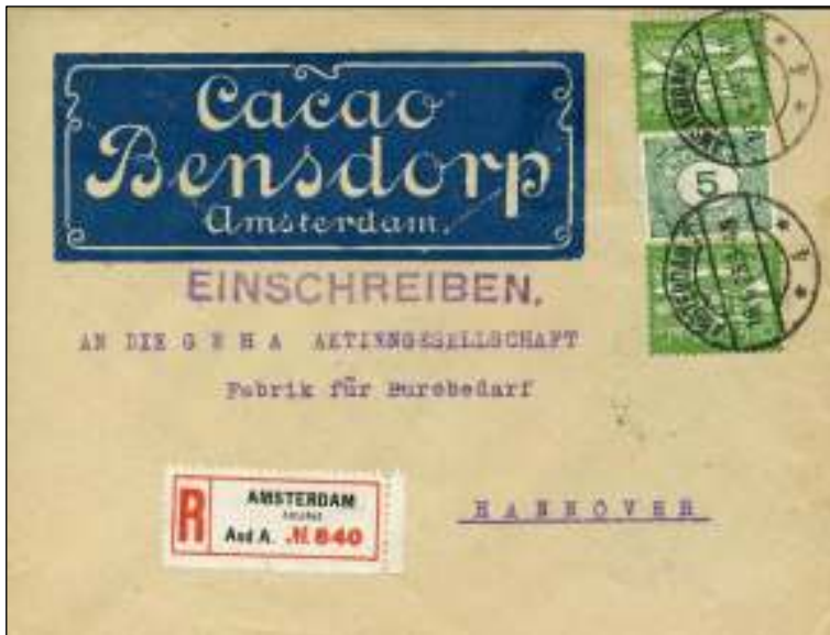
Amsterdam-Amstel, 16 juni 1923. Aangetekende brief met bestemming Hannover, Duitsland. Tarief: Brief tot 20 gram 20 cent, aantekenenrecht 15 cent. Mengfrankering met cijfer 1921/1922.