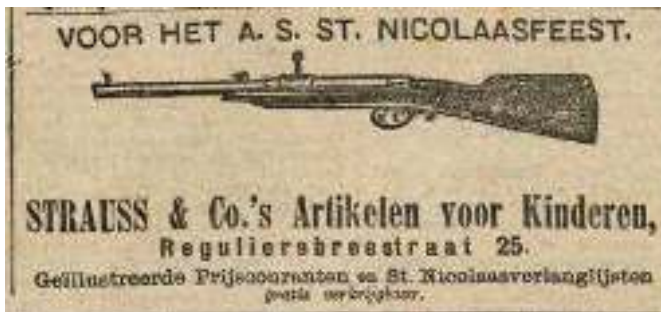
'Artikelen voor Kinderen'.