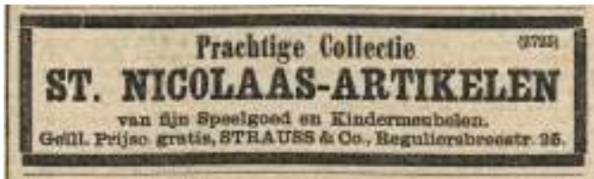
'fijn Speelgoed en Kindermeubelen'.

Nu de stofwolken weer voor even lijken te zijn neergedaald, die de verhitte Pieten-discussie in aanloop naar de verjaardag van de Goedheiligman heeft laten opwaaien, lijkt het een goed moment de blik te richten op een briefkaart (zie hiernaast) die de afzender op 29 oktober 1896 schreef uit Rosmalen naar de Firma Strauss en Co. te Amsterdam, en waarin deze vroeg om toezending van 'Uw St. Nicolaas prijscourant'. Deze Staus en Co. exploiteerde rond 1900 in een perceel van drie verdiepingen hoog aan de Reguliersbreestraat 25 een groot speelgoederen-magazijn. Enkele advertenties in Het Nieuws van de Dag in de jaren '90 kunnen een indruk geven van wat we ons daarbij moeten voorstellen.