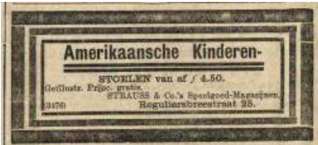
'Amerikaansche Kinderen-Stoelen van af f 4.50'.