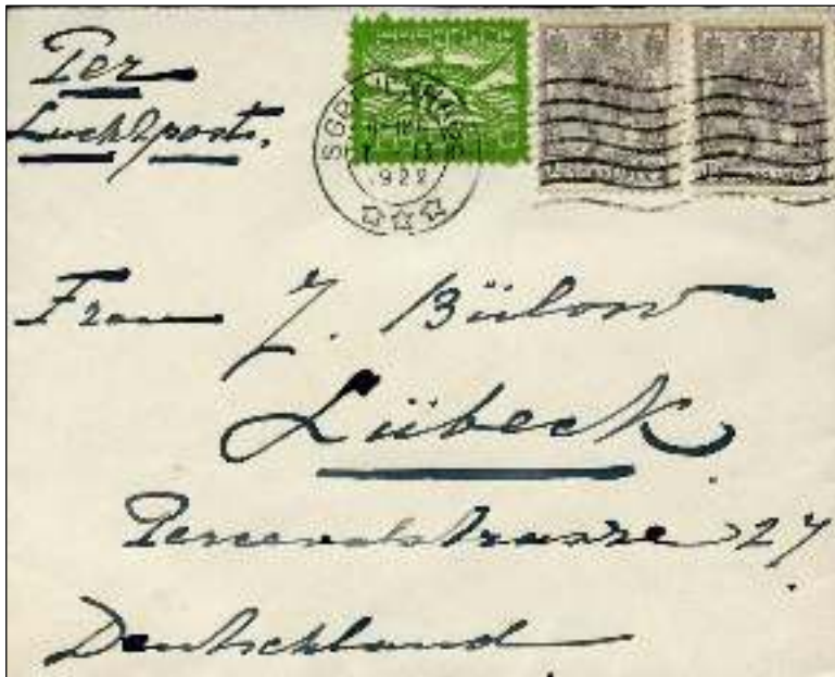
's-Gravenhage, 7 februari 1922. Brief per luchtpost met bestemming Lübeck, Duitsland. Tarief: brief tot 20 gram 20 cent, luchtrecht per 20 gram 15 cent. Verplichte luchtpostzegel voor het luchtrecht.