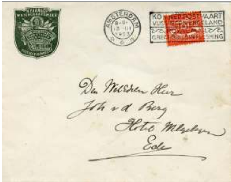
Amsterdam, 13 maart 1923. Brief met bestemming Ede. Tarief: brief tot 20 gram 10 cent. Vanaf 7-2-1923 waren de zegels geldig voor algemeen gebruik.