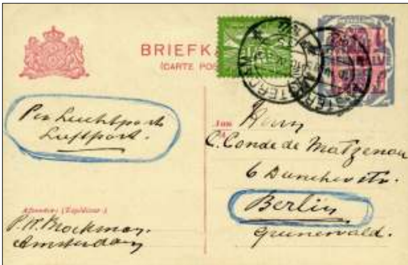
Amsterdam, 10 april 1922. Briefkaart met bestemming Berlin-Grunewald, Duitsland. Tarief: briefkaart naar het buitenland 12½ cent, luchtrecht voor briefkaart 15 cent. Verplichte luchtpostzegel voor het luchtrecht.