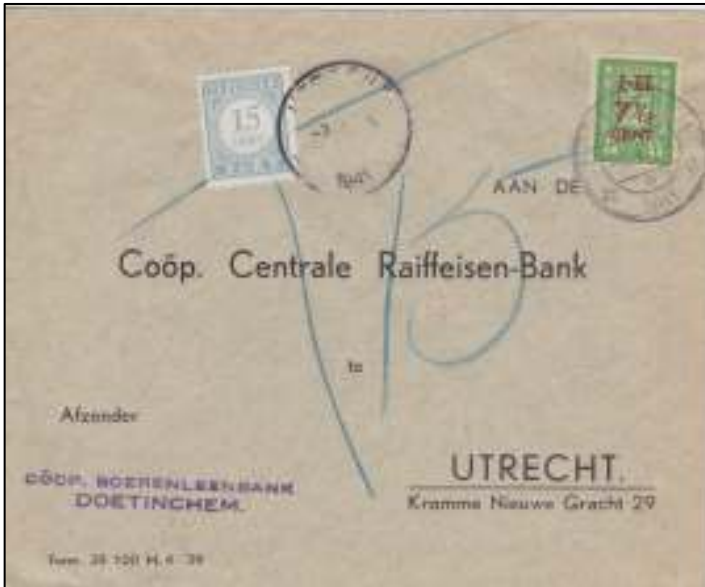
Doetinchem, 6.1.1941. Brief met bestemming Utrecht. Frankering met een rentezegel van 7½ cent. Brieftarief 7½ cent tot 20 gram van 20.8.1940 tot 1.11.1946. Het tekort is verdubbeld tot 15 cent.