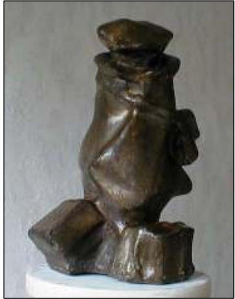
Het beeldje van opzij en van voren.