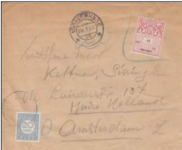
's-Gravenhage, 29.1.1947. Brief met bestemming Amsterdam. Frankering met een kwitantiezegel van 10 cent. Brieftarief 10 cent tot 20 gram van 1.11.1946 tot 1.11.1957. Verdubbeld tot 20 cent.