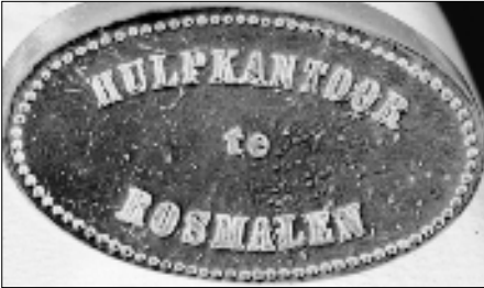
Afb. 8: Lakstempel van het hulpkantoor te Rosmalen. Hiermee werden geldzendingen verzegeld.