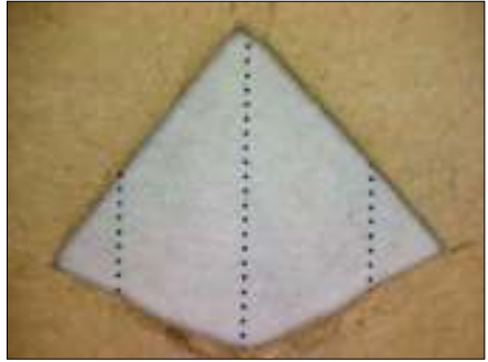
De knip aan de voorzijde en de achterzijde van de kaart.