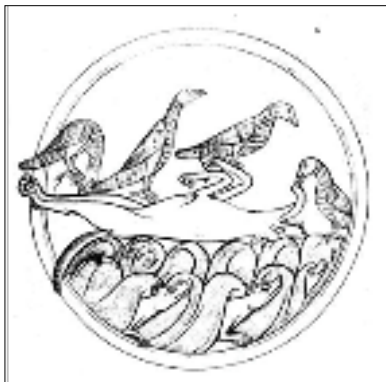
De vos die veinst dood te zijn (12 e eeuw).

Fijne feestdagen en een gelukkig en voorspoedig nieuwjaar!