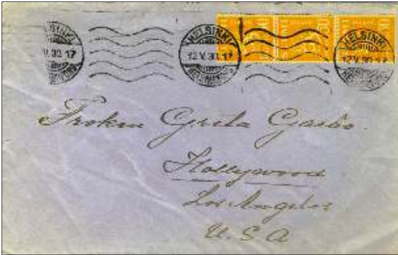
Afb. 2: Brief aan Greta Garbo uit Helsinki, 1930.

De briefomslag uit Helsinki uit 1930 is aan haar geadresseerd.