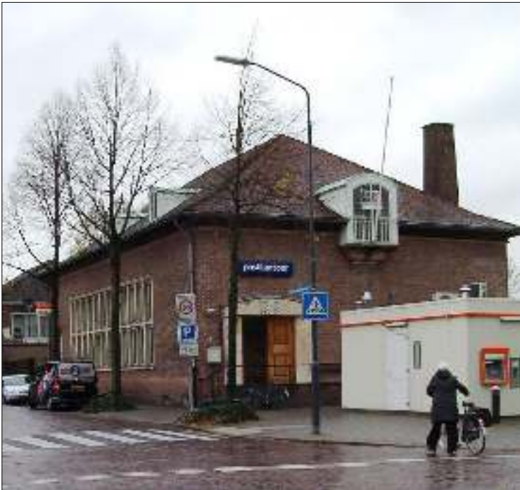
Afb. 6: Het gebouw stond er de laatste dag mistroostig op die druilerige 5 e november.