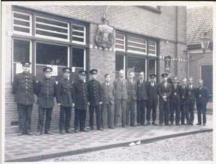
Afb. 5: Echte nostalgie: het vooroorlogse postkantoor van Vught met het voltallig aangetreden personeel.