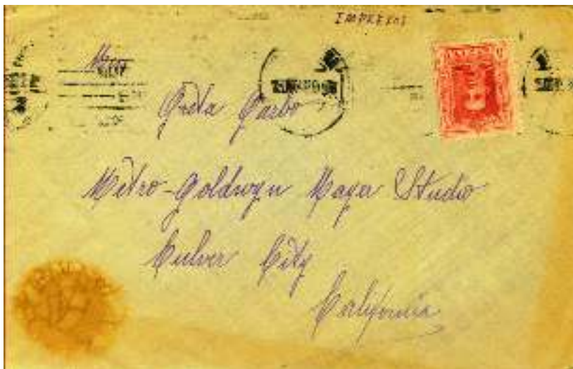
Afb. 3: Brief aan Greta Garbo uit Barcelona, 1930.

Of beide afzenders ooit de door hun gewenste foto van Greta hebben gekregen weet ik niet.