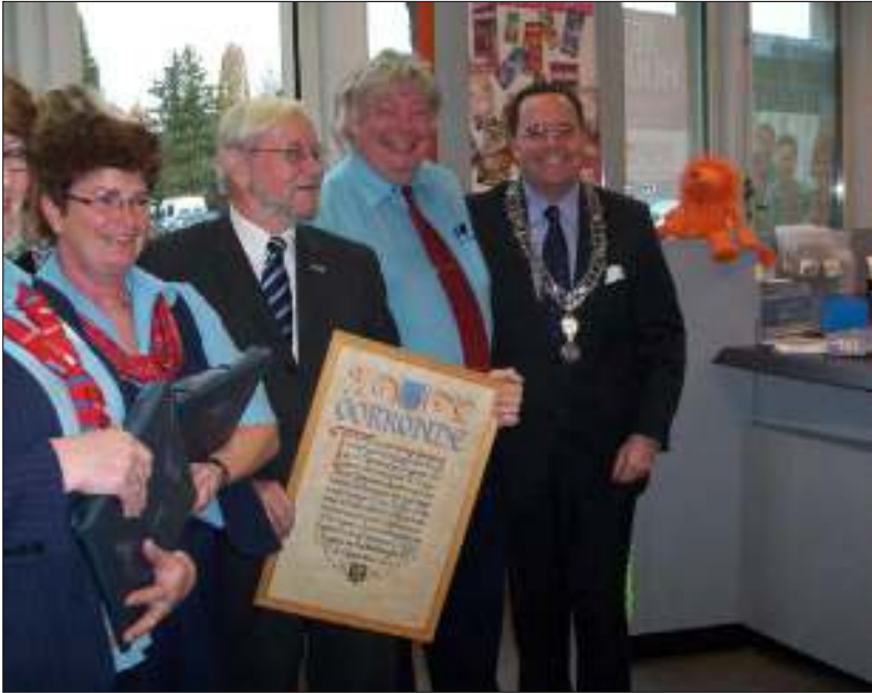
Afb. 3: Historisch besef blijkt ook uit deze foto. De oorkonde, temidden van burgemeester en medewerkers van het postkantoor, luisterde in 1941 de opening op van het postkantoor aan de Raadhuisstraat. De oorkonde krijgt voortaan een plaats in het Vughts Historisch Museum.