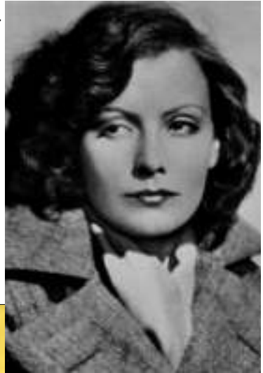
Afb. 4: Greta Garbo ca. 1930.