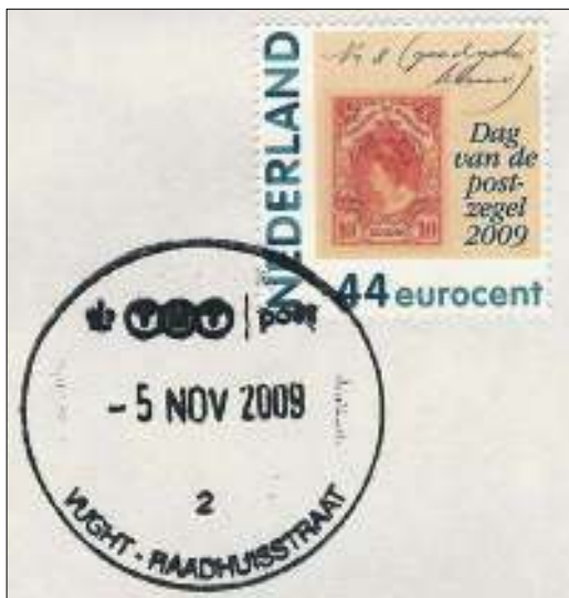
Afb. 7: Laatste-dag-stempel van het postkantoor aan de Vughtse Raadhuisstraat.

Naschrift: Onze correspondent in Vught, Ad Anemaat, maakte de foto's voor de afbeeldingen 2, 3 en 6. Een oplettende lezer kan hem in actie zien links van het midden op de foto van afb. 1. Namens de redactie hartelijk dank.