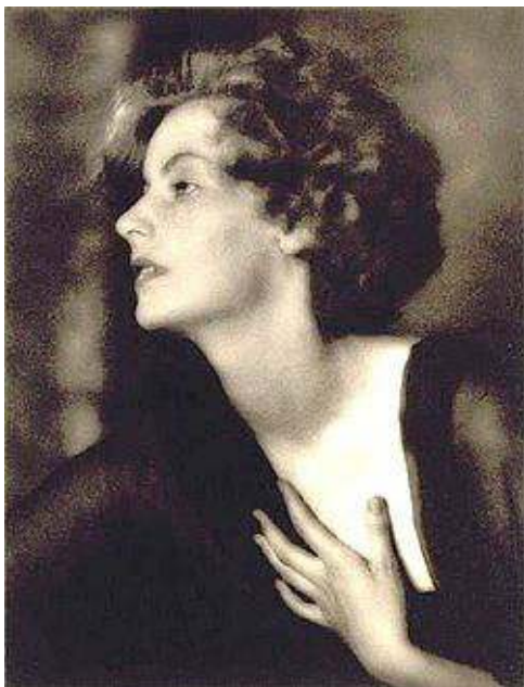
Afb. 1: Garbo in 1925.

Liep laatst weer eens door een bak buitenlandse poststukken te 'spitten'. Daar zat eigenlijk niets bijzonders in. Totdat mijn oog viel op de naam van de geadresseerde op twee poststukken.