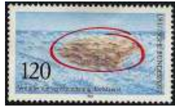
afb. 2: Houdt de zee schoon!

De consumptie nam toe, de temperatuur van de aarde neemt nog steeds toe en de hoeveelheid broeikasgassen neemt alleen maar toe, ondanks alle afspraken. Daar staat tegenover dat er genoeg postzegelmissies zijn die met het milieu te maken hebben, het is een dankbaar onderwerp. Zo wees West-Duitsland al in 1982 op de vervuiling van de zeeën (afb. 2).