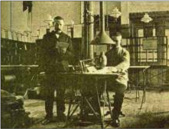
Een 'stempelaar' aan het werk met de machine

In die tijd was het welzijn van dier, plant en milieu nog geen 'hot item', maar diende deze manier van vernietigen van de postzegel om hergebruik van de zegels tegen te gaan