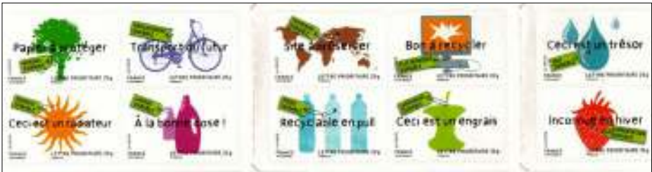
afb. 3: Frans carnet

De aanleiding tot het schrijven van dit stukje is het verschijnen van een aardig en kleurrijk Frans 'carnet' (postzegelboekje) (afb. 3 en 4) met als motto duurzaamheid.*) Duurzaamheid is het voortdurend en in alle opzichten voorzichtig, sparend en behoudend omgaan met de omgeving.