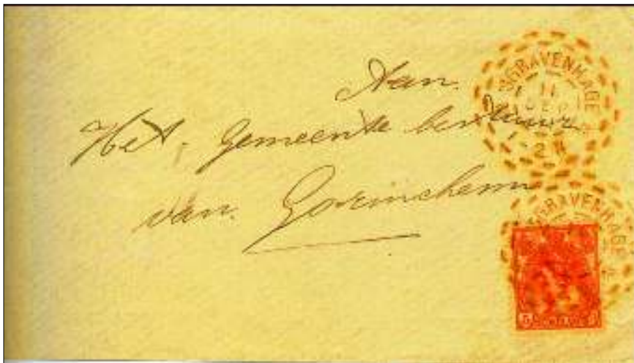
Brandstempel 'SGRAVENHAGE 11 SEP 01; 1-2N

Een goed geoefende stempelaar kon ongeveer 100 stukken per minuut verwerken.