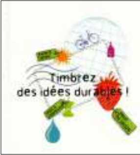
Afb. 4: tab van het besproken carnet: 'Gebruik postzegels met duurzame ideeën!'

Het autogebruik wordt niet eens genoemd, want hierop rust een taboe; ja, via een omweg wordt het fietsen aangemoedigd.