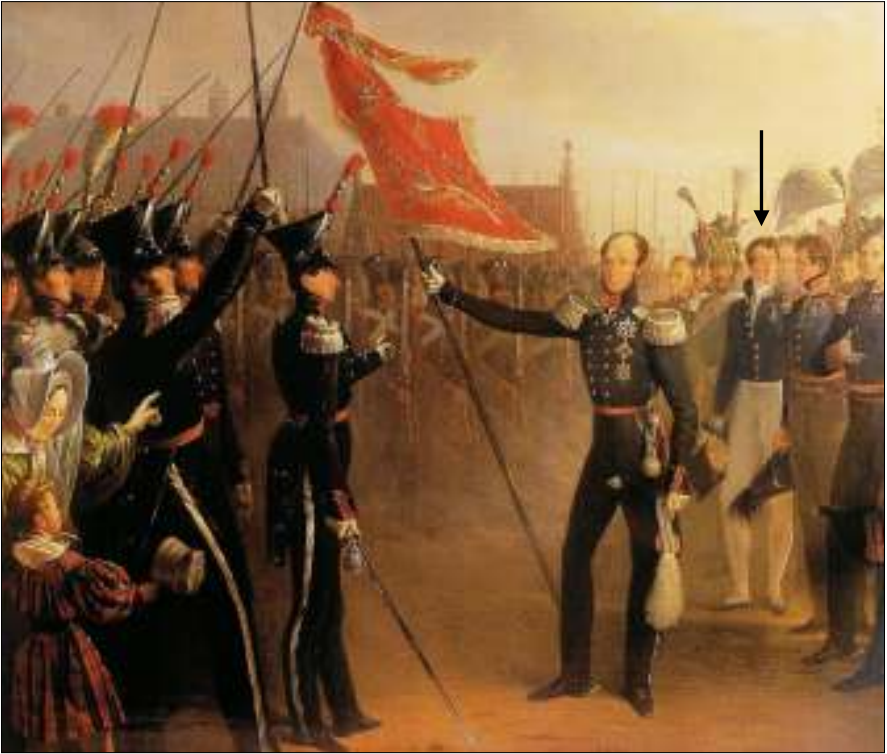
Afb. 2: De uitreiking van het vaandel aan de Bossche Schutterij, 1831. Het pijltje wijst naar Baron Van den Bogaerde.

de spreekwoordelijke lont in het kruitvat. Nog geen jaar later werd Leopold van Saksen-Coburg gekozen tot koning der Belgen en op 21 juli 1831 werd hij ingehuldigd in de hoofdstad Brussel (afb. 3).