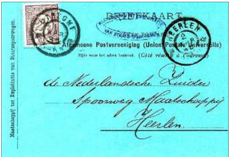
Afb. 4: Briefkaart van de Chef van Dienst van de Staatsspoorwegen aan zijn collega in Heerlen om tijden van een extra trein door te geven (z.o.z.). Zou de N.S. dat anno 2005 nog per briefkaart durven?!