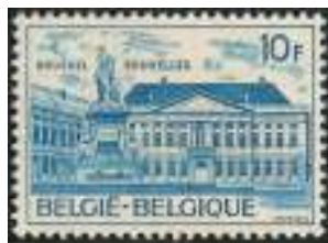
Afb. 7: Martelarenplein te Brussel

Weliswaar verscheen in 1975 een postzegel met daarop het Martelarenplein te Brussel. Maar dat was niet om de martelaren van 1830 te herdenken, voor wie op dat plein een gedenkteken is opgericht. De zegel kwam namelijk uit ter gelegenheid van het Europees Jaar voor het Bouwkundig Erfgoed (afb. 7).