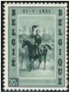
Afb. 3: Postzegel t.g.v. de herdenking in 1957 van de aankomst van koning Leopold I te Brussel op 21 juli 1831

Daarop besloot koning Willem I tot een militaire actie: een inval in België met een leger van 37.000 man. Deze zou duren van 2 tot 12 augustus 1831 en staat bekend als 'de Tiendaagse Veldtocht'. De veldtocht verliep voor de Nederlanders in eerste instantie zeer voorspoedig. Maar toen kwam Frankrijk, daarin gesteund door Engeland, tussenbeide. Tegen de grote Franse troepenmacht van 50.000 man voelde men zich niet bestand. Het Nederlandse leger trok zich terug en de soldaten werden thuis als nationale helden ingehaald.