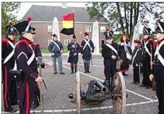
Afb. 4: De Bossche Schutterij anno 2006

De moed en daadkracht van de Bossche schutterij is toen dermate hooggewaardeerd, dat niet minder dan vier mannen werden benoemd tot Ridder der Militaire Willemsorde 4 e klasse (afb. 5).