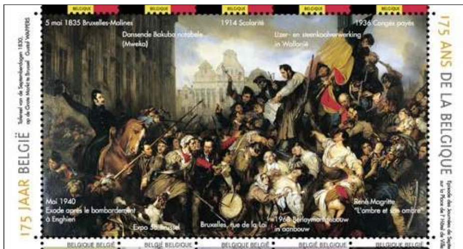
Afb. 8: Gustaf Wappers, Tafereel van de Septemberdagen 1830 (444 x 660 cm)