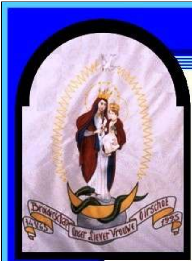
Broederschap Onser Lieve Vrouwe Oirschot herdacht in 1995 zijn 500-jarig bestaan.