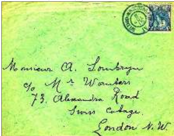
Afb. 6: Ook postvervoer 'per conducteur' was mogelijk op deze lijn. Hier een voorbeeld van een brief met het grootrond lijnstempel Sittard – Herzogenrath op een brief van Voerendaal naar Londen.