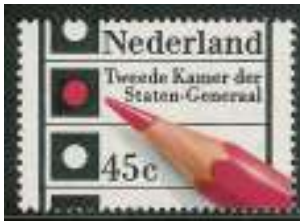
De oorspronkelijke postzegel