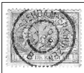
A'dam-Enkhuizen (B = terugtraject)