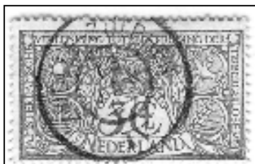
Zwolle-Zutphen (IV = heentraject)