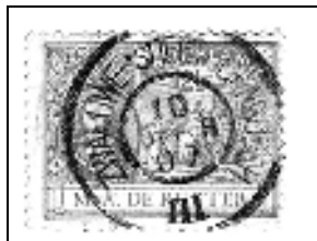
Zwaluwe-'s-Hertogenbosch (III = heentraject)