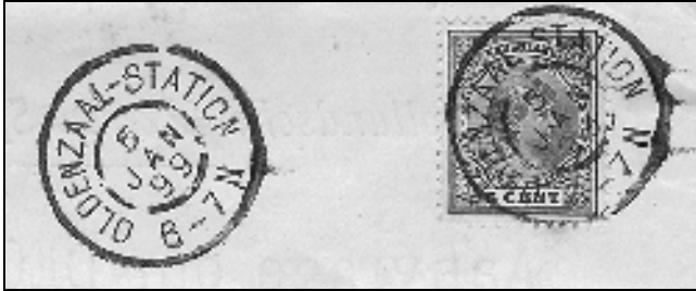
Oldenzaal – Station

Soms treft men postzegels aan die met een stationsstempel ongeldig zijn gemaakt. Deze zegels zijn dan gebruikt voor treinbrieven die aan het bagageloket werden afgegeven en niet in een postrijtuig, maar in de bagageafdeling zijn vervoerd. Bijvoorbeeld: