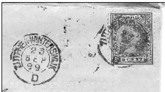
Zutphen-Winterswijk (D = terugtraject)