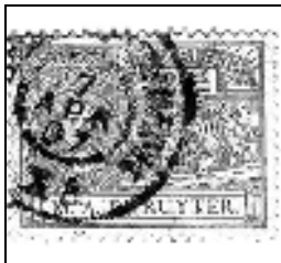
A'dam-Emmerik (XA = gedeeltelijk traj.)