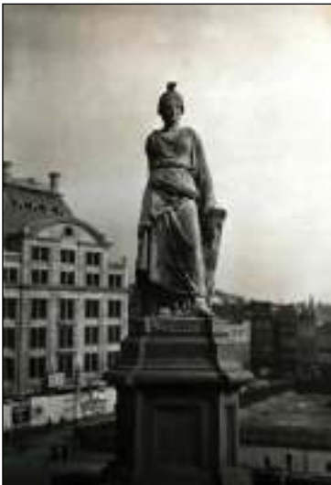
Afb. 2: Naatje.

Op 27 augustus 1856 werd in aanwezigheid van Koning Willem III het 'Monument ter nagedachtenis aan de Nationale Geest van 1830-1813' onthuld. Het initiatief daartoe was genomen door voormalige strijders van de Tiendaagse Veldtocht.