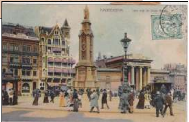
Afb. 1: Amsterdam naar Parijs, 6 februari 1906, 12-2V.

De portokosten van 40 Centimes zijn ten onrechte in rekening gebracht, omdat de postbeambte de postzegel van 2½ cent aan de voorkant van de kaart niet heeft opgemerkt.