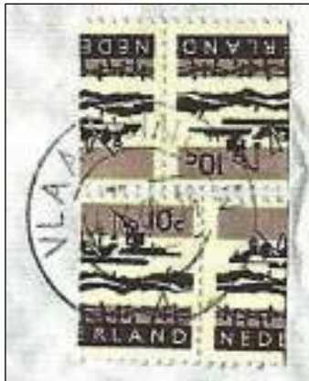
Twee in de postzegelautomaat versneden postzegels van 10 cent 'landschap', 14.10.1968.

Bronnen o. a. Handboek Postwaarden Nederland A24 en A30.