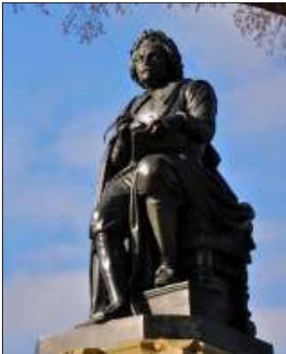
Joost van den Vondel, Amsterdam.