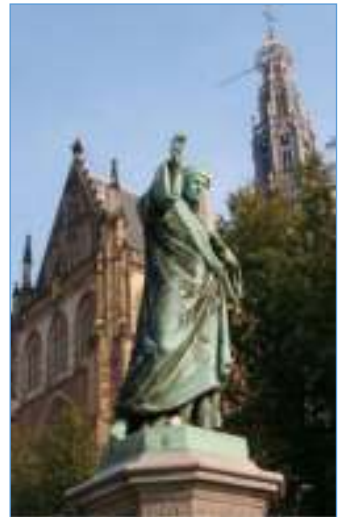
Laurens Janszoon Coster, Haarlem.

Louis Royer stierf in 1868 in Amsterdam.