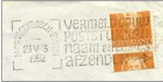
Een in de postzegelautomaat versneden postzegel van 10 cent Juliana 'en face', 23.5.1952.