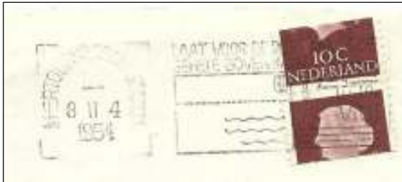
Een in de postzegelautomaat versneden postzegel van 10 cent Juliana 'en profil', 8.2.1954