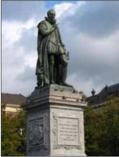
Willem van Oranje, Den Haag.

Ik heb geen postzegels kunnen vinden met de standbeelden, gemaakt door Louis Royer, van Willem de Zwijger, Rembrandt en Joost van den Vondel. Iemand anders misschien wel?