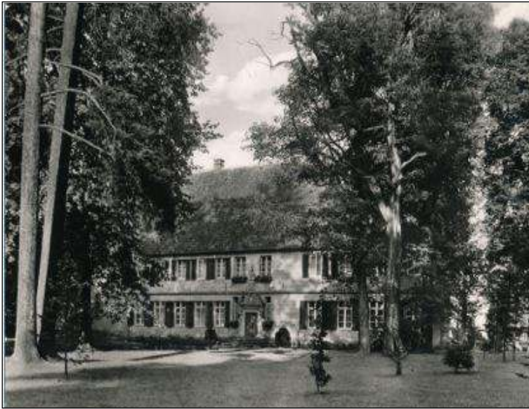
Afb. 3: Schloss Bentlage.