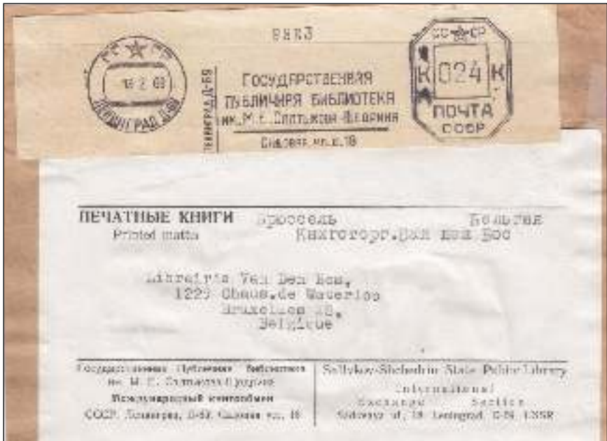
Leningrad, 13 februari 1968 . Voorzijde van drukwerkpakket met bestemming Brussel, België. Mechanische frankering van 24 kopeken. D. v. d. L.