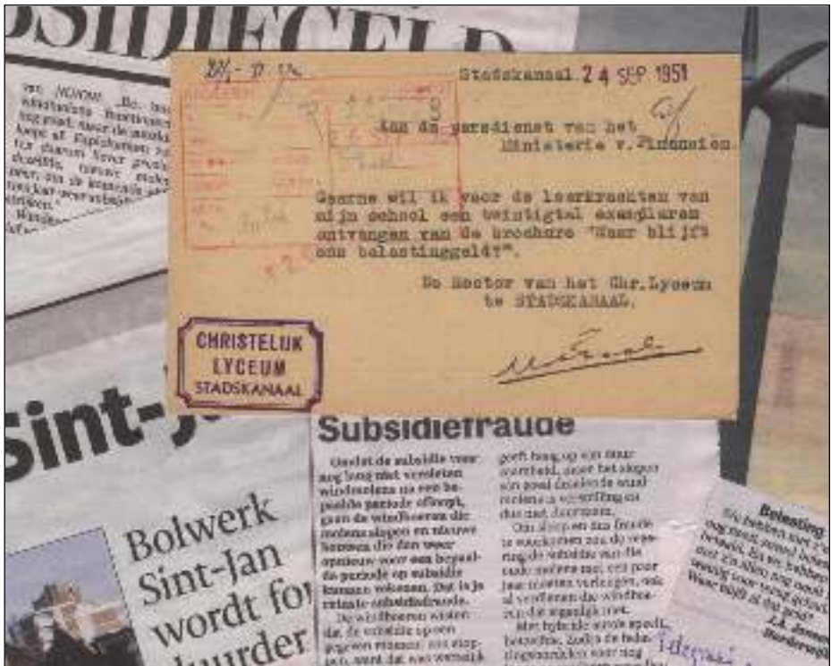
Afb. 1: Waar blijft ons belastinggeld is 63 jaar later nog actueel

De vraag 'Waar blijft ons belastinggeld?' is van alle eeuwen. Is het humor omdat er zelden een goed antwoord op gegeven wordt? Neen, eigenlijk niet. Ook in december 2014 wordt deze serieuze vraag in het nieuws gebracht.