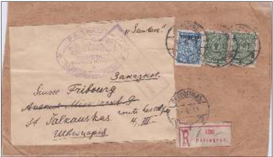
Petrograd, 8 juni 1917 , Juliaanse kalender (21 juni volgens de Gregoriaanse kalender die Rusland na de oktober revolutie in 1917 pas zou invoeren). Tarief: 14 kopeken, zie hiernaast. Paars rechthoekig censuurstempel.