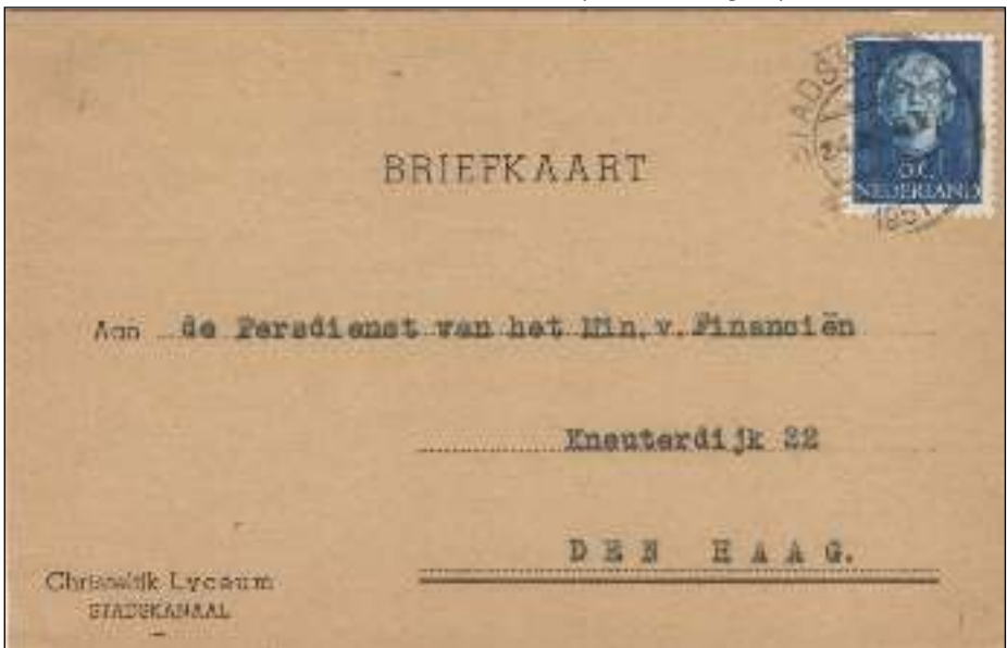
Afb. 2: De briefkaart gericht aan de Persdienst

Of de leerstof uit de brochure de – inmiddels gepensioneerde – leerlingen in 1951 duidelijk heeft kunnen maken waar het belastinggeld van hun ouders bleef zal voor de lezer van toen en nu wel altijd een vraag blijven.