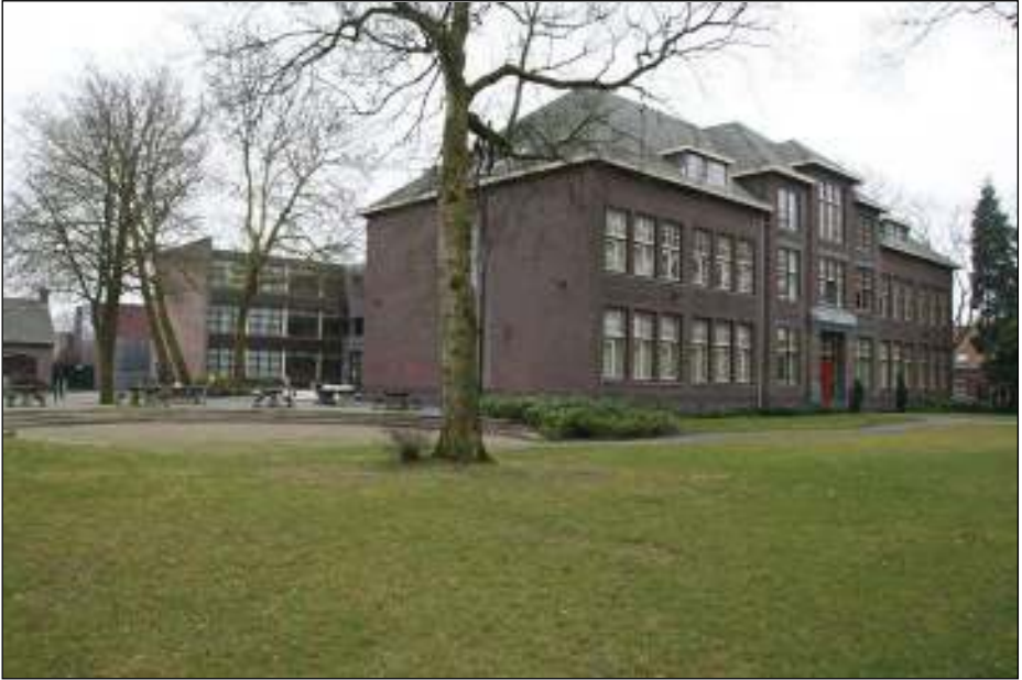
Afb. 3: Het rechter gebouw is het Ubbo Emmius Lyceum aan de Stationslaan te Stadskanaal, 1926

Het hamerstempel is op 5 juli 1923 door De Munt verzonden en van 6 juli 1923 tot en met 29 oktober 1953 gebruikt.