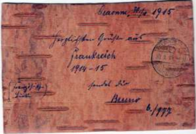
Berkenschors gebruikt als Feldpostkarte.