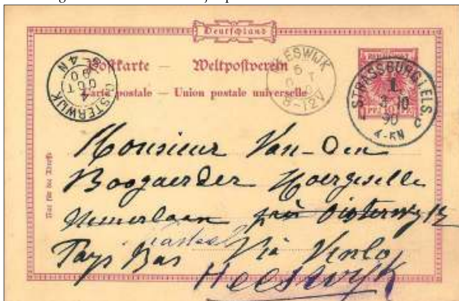
Afb. 1: Briefkaart van Straatsburg 3 Oktober 1890, via Oisterwijk naar Heeswijk.