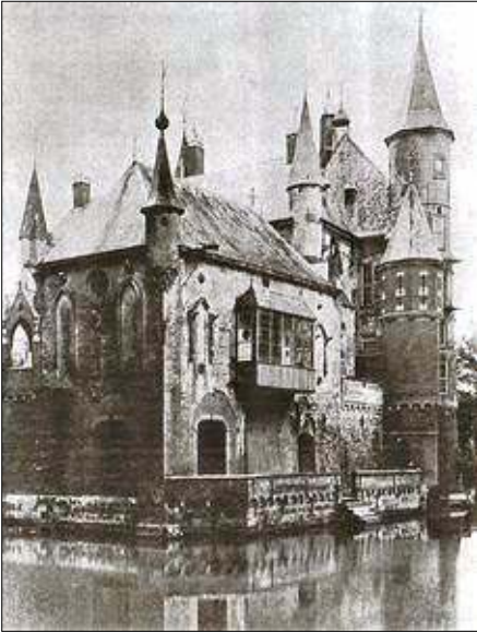
Afb. 2: Kasteel Heeswijk ca. 1890.