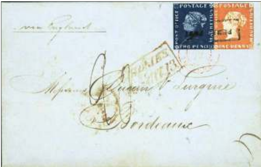
Afb. 3: De 'Bordeaux envelop'; privé verzameling.

Op vrijdag 2 september vindt een internationaal colloquium plaats. Daar zullen curatoren, specialisten en expert verzamelaars van gedachten wisselen over kwesties die verband houden met de Mauritius 'Post Office' zegels. De tentoonstelling vindt plaats van 2 tot 25 september a. s. Het aantal beschikbare entreekaarten is beperkt. Voor zover nog voorradig kan men ze bestellen bij bovengenoemde website. (Alleen deze website heeft al een exclusieve uitstraling en u moet er beslist een kijkje nemen.) Kaartjes voor een bepaald tijdstip kosten € 8. VIP-kaartjes zonder tijd-beperkingen kosten € 22. H. v. W.