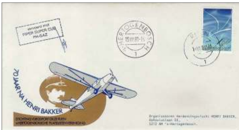
Afb. 5: Onderaan de officiële envelop. Daarboven twee commerciële uitgaven die foutief 14 augustus als datum van de vlucht vermelden.