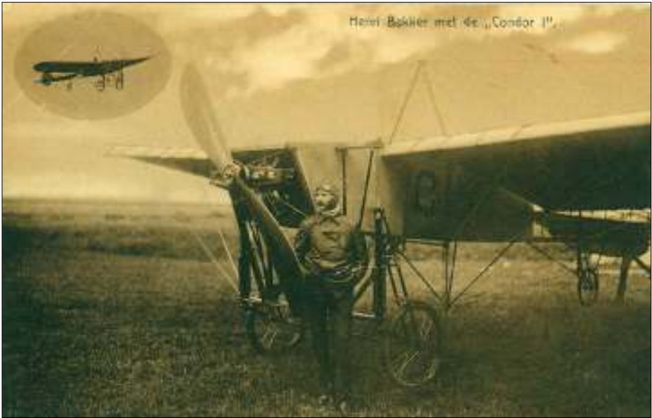
Afb. 1: Henri Bakker met zijn Condor, een tweezits Blériot, tijdens de militaire manoeuvres in het Bossche Broek, september 1911.