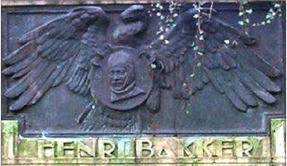
in het rondel aan de Hekellaan.