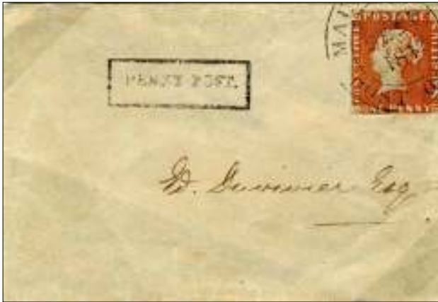
Afb. 2: De 'Ball cover' uit de collectie van koningin Elizabeth II.