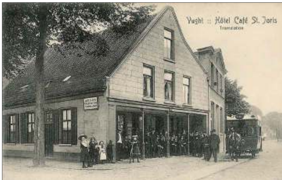
Afb. 4: Café St. Joris omstreeks 1910. In dit café was (hoogstwaarschijnlijk) het postkantoor ondergebracht van ± 1870 tot 1882. Het ligt op de hoek Maurickplein/Marktveld aan het begin van de Taalstraat. Het café diende tevens als 'tramstation' voor de paardentram van 's-Hertogenbosch naar Voorburg.

eenvolgens: timmerman, schrijnwerker, tapper (herbergier), brievenbesteller en zijn vrouw als herbergierster. Er waren drie mannen inwonend. In 1891 was hij 'opzichter' en bij zijn overlijden in 1907 'zonder beroep'.