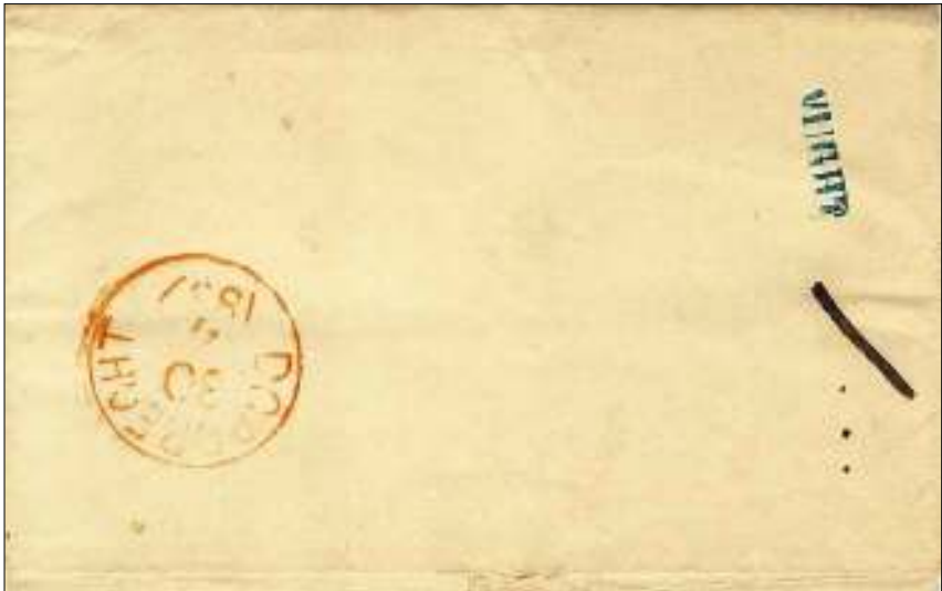
Afb. 1: brief uit 1857 van Vught via 's-Hertogenbosch naar Dordrecht. Kantoornaamstempel VUGHT en doorgangsstempel SHERTOGENBOSCH 29/4 1857. Aankomststempel Dordrecht 30/4 1857.