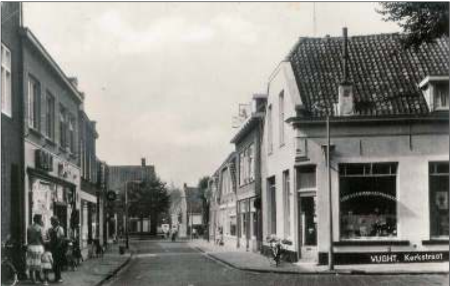
Afb. 3: Een foto van omstreeks 1960. In het hoekhuis rechts met de karakteristieke deur op de hoek van de gevel, hoek Dorpstraat/Kerkstraat, was 100 jaar eerder, omstreeks 1860, het postkantoor gevestigd.

Verhagen wordt in de registers met verschillende beroepen aangeduid, achter-