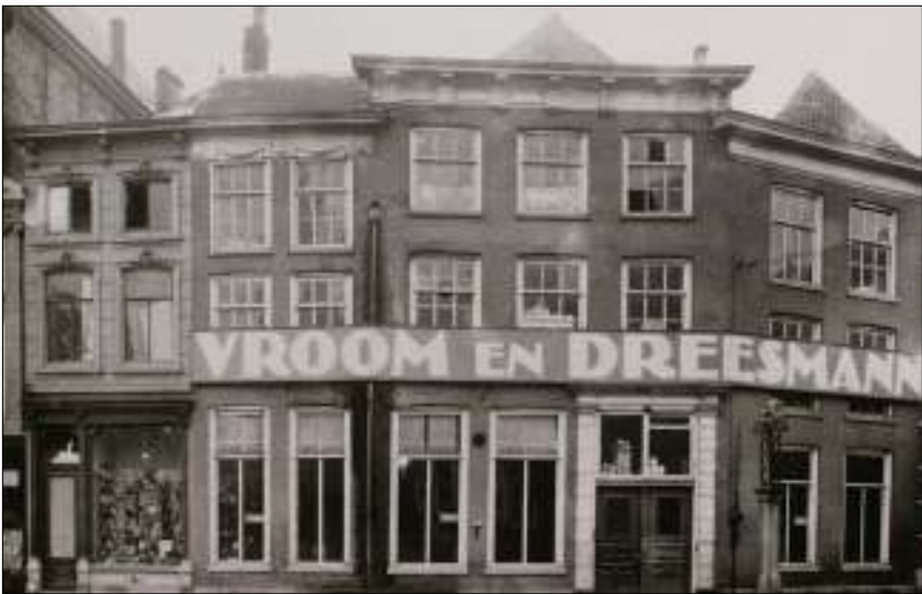
Afb. 7: Niet duidelijk is wanneer De Hanzebank waar in de stad was ondergebracht. De Vismarkt en Stationsweg worden wel genoemd. Volgens het Stadsarchief zat de bank op het laatst in deze vier panden aan de Schapenmarkt nr. 4 t/m 10, hier rijp voor de sloop om in 1929 plaats te maken voor de nieuwbouw van Vroom en Dreesmann.