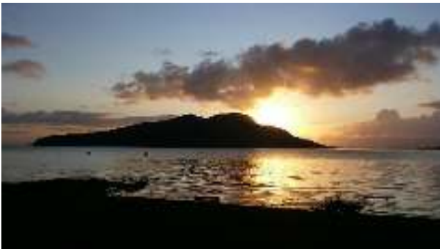
De zon komt op achter Holy Island.