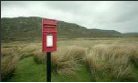
Brievenbus op Bernera Island.

Via Wikipedia ben ik erachter gekomen waar die eilanden liggen: