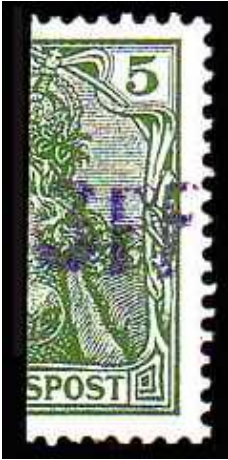
Afb. 2: Vineta-provisorium .

knippen. Met een handstempeltje werd er in paars 3PF opgedrukt. Dat druiste in tegen de regels van de Reichspost. Aanvankelijk wilde deze de krantenwikkels dan ook niet bezorgen.