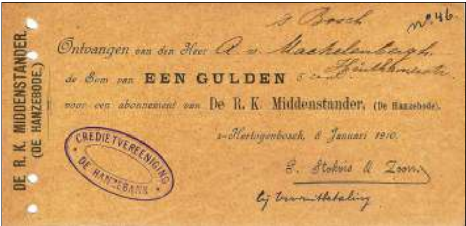
Afb. 3: De Hanze gaf ook een eigen tijdschrift uit: 'De Hanzebode'.

Na de oorlog brak ook in Nederland weldra de crisis uit. De omzetten daalden. Daardoor konden de middenstanders hun investeringen en belastingen niet meer afbetalen. De Hanzebank beconcurrerde tijdens deze malaise nota bene haar eigen middenstand en ging vanwege haar grote en ongedekte kredieten enorme verliezen lijden. Ze was voorbij gegaan aan haar taak als middenstandsbank en gaan redeneren als een grootbank. Desondanks handhaafde de directie maximale dividenden en tantièmes. De jaarverslagen gaven een geflatteerd beeld. Want koste wat kost moest het imago van de succesvolle bank worden gehandhaafd, in de hoop op betere tijden.