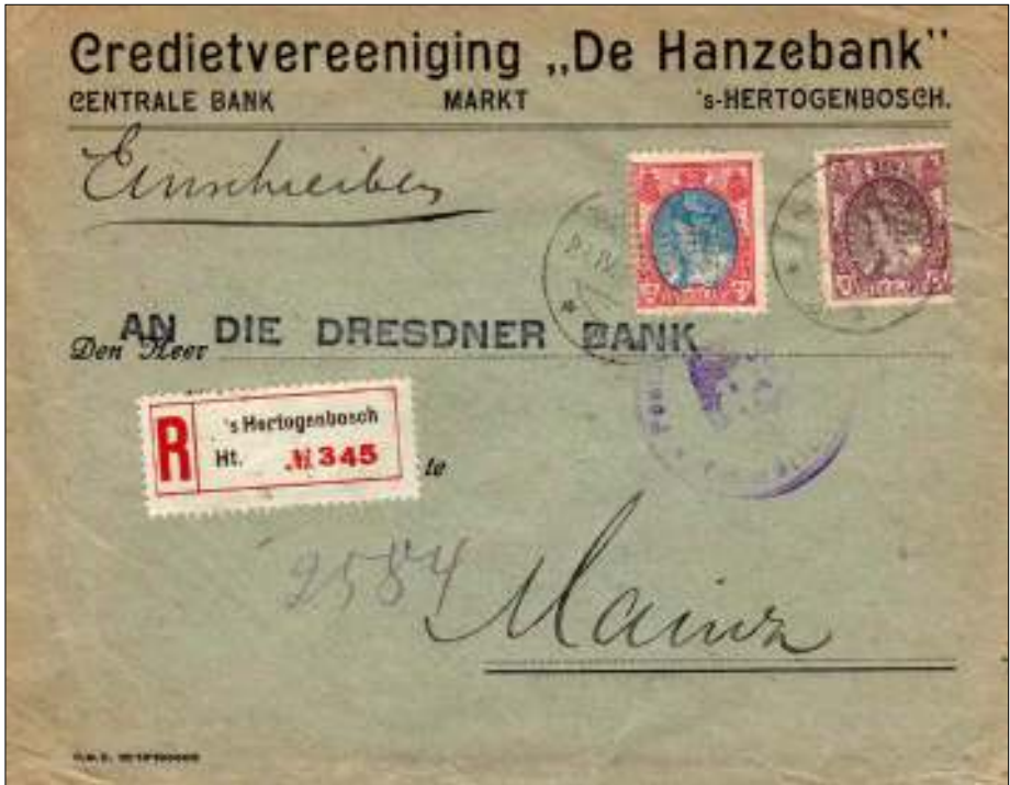
Afb. 5: Pracht brief van De Hanzebank d. d. 21 april 1921, met twee postzegels met de perfin 'H. B.'. (Met dank aan de heer Jan Verhoeven en mevrouw Jacqueline Birnie.)

Op zaterdag 16 juni 1923 vroeg De Hanzebank Den Bosch bij de rechtbank surséance van betaling. Er ontstond een run en om half twaalf sloot men de kassa. Het publiek reageerde natuurlijk uiterst nijdig. 'Er zijn zoo vele kleine mensen gedupeerd!' Den Haag voelde desgevraagd niet voor steun, vanwege de verzuilde instelling van de bank en het wanbeleid. Intussen hadden bestuur en directie hun eigen belangen tijdig in veiligheid gebracht, onder meer bij de Boerenleenbank. Op 8 december 1923 sprak de rechter het faillissement uit.