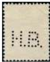
Afb. 1: Vanaf 1917 had De Hanzebank de firmaperforatie H.B. in gebruik.

Nederland handhaafde tijdens de Eerste Wereldoorlog van 1914-1918 zijn neutraliteit, maar had wel last van de stagnerende economische ontwikkeling. Er was weliswaar geld. Maar er konden geen grondstoffen worden geïmporteerd. En daardoor was er gebrek aan industriële investeringen. Juist in die moeilijke tijd trad De Hanzebank buiten haar eigenlijke taak en functie: ze ging speculatief 'beleggen' en riskante grote kredieten verstrekken, liefst bij familiebedrijven van bestuursleden van de bank. Ook zette men kostbare, prestigieuze bankgebouwen neer. In 1916 waarschuwde de accountant al voor de risico's. De Nederlandse Bank liet zich dat jaar kritisch uit over het gebrekkige beheer: het bestuur van de Hanzebank is 'in onbekwame handen'.