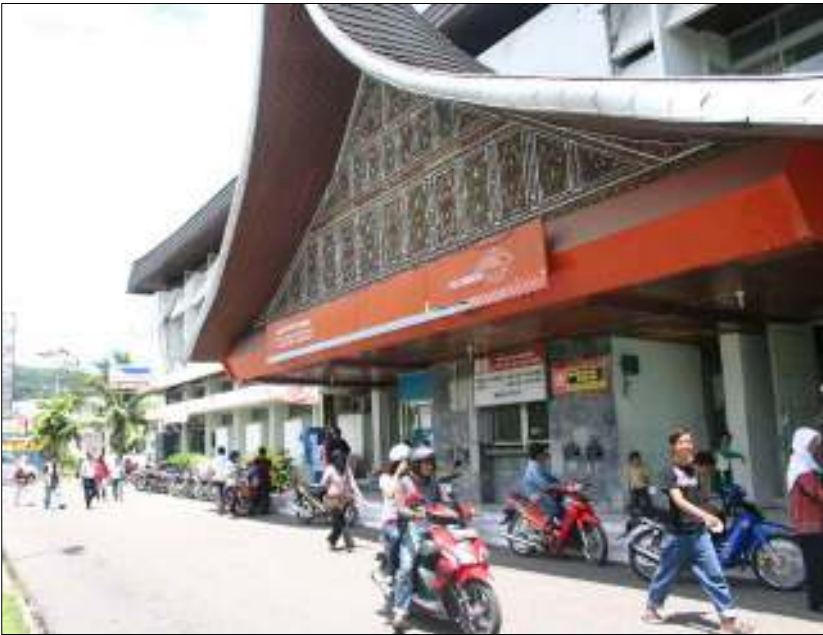
Afb. 1: het postkantoor van Padang

De Minangkabau bouwstijl stamt al van eeuwen geleden en is kenmerkend voor west en midden Sumatra. De dakvorm valt meteen op.