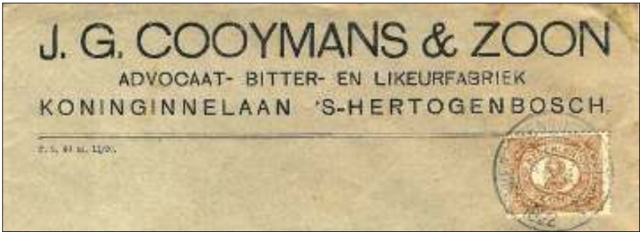
Afb. 5: firmabrief van 6.X.1922 met 2 cent drukwerktarief; firmaperforatie