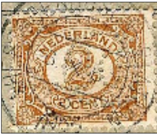
Afb. 5a: bovenstaande zegel uitvergroot