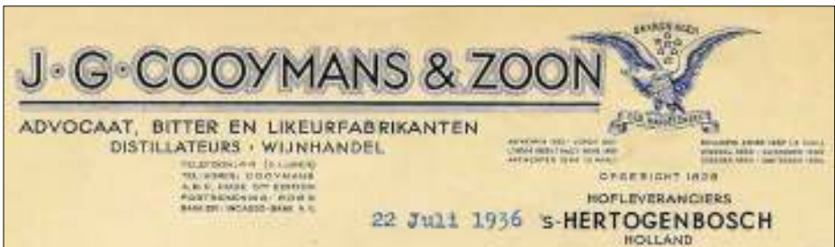
Afb. 7: briefhoofd met de adelaar als handelsmerk