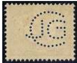
Afb. 5b: perfin JGC