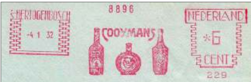
Afb. 6: frankeerstempel 4.1.1932; Francotyp, model C