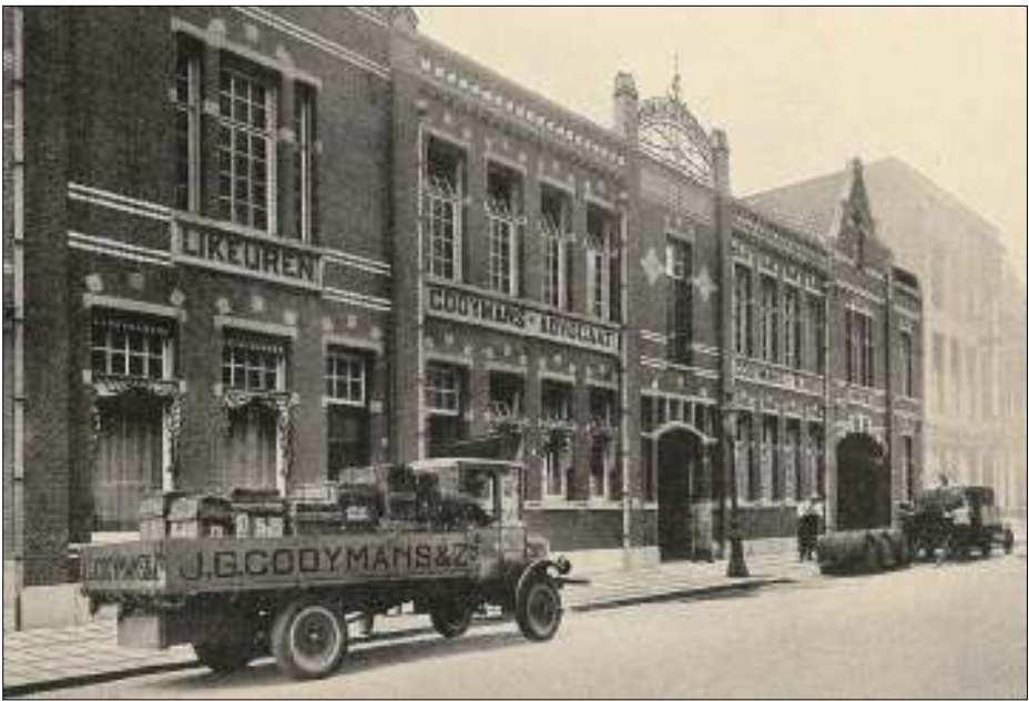
Afb. 3: de fabriek aan de Koninginnelaan