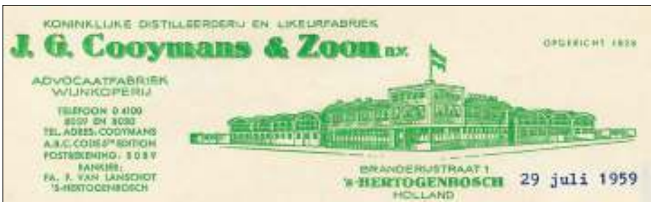
Afb. 11: Briefhoofd van de Koninklijke Coymans met een afbeelding van de (intussen al weer gesloopte) nieuwbouw aan de Branderijstraat. De naam van de straat is toepasselijk en dat is niet toevallig.