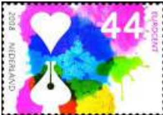
Postzegel 'Weken van de Kaart'

Op 8 juli zijn (onverwacht) 3 postzegels van €0,92 verschenen o.d.t.: Grenzeloos Nederland; Nederlandse Antillen & Aruba.