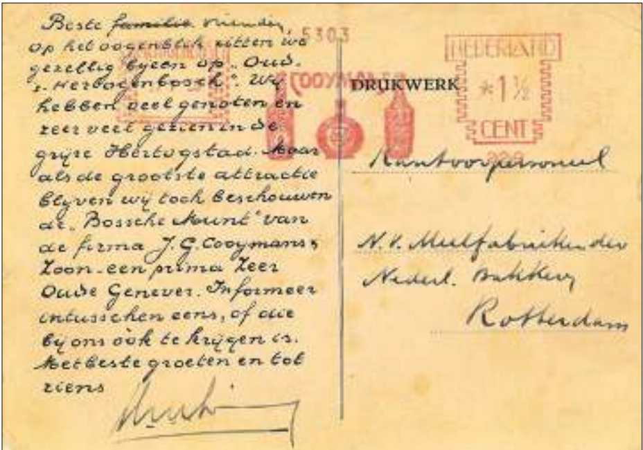
Afb. 8: Prentbriefkaart met voorgedrukte tekst, uitgegeven in 1935 t. g. v. 750 jaar 's-Hertogenbosch. Drukwerk tarief 1½ ct. Frankeerstempel als bij afb. 6.