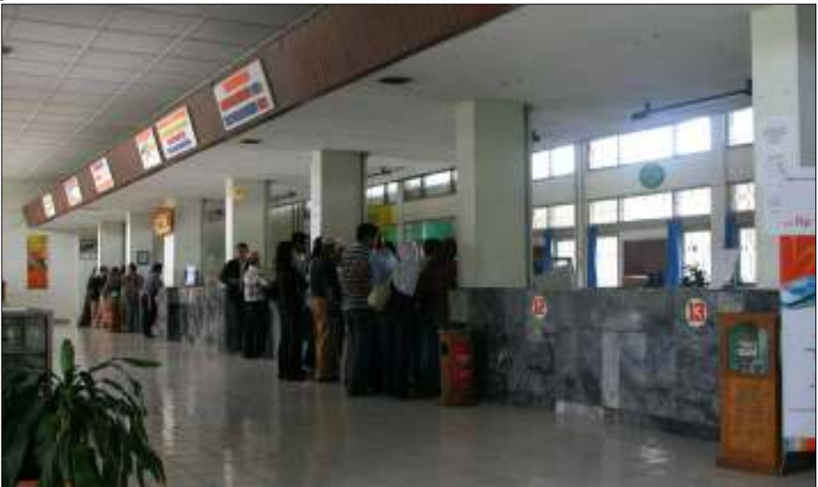
Afb. 2: de loketten in het postkantoor van Padang

Ter rechterzijde bij binnenkomst stonden lange houten banken in rij en gelid. Kennelijk soms nodig om mensen te laten wachten, misschien voor die pensioenen?