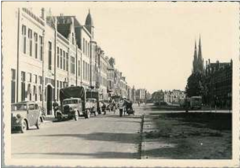
Afb. 9: Links op de foto: twee Duitse vrachtwagens en Duitse militairen voor de fabriek van Coymans aan de Koninginnelaan.