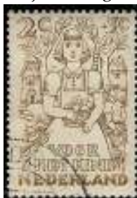
Gebruikt of Gebruikt?

Daarbij komen nu ook die zogenaamd gebruikte, nagestempelde zegels mét gom en dat zijn dus eigenlijk heel vreemde eenden in de bijt.