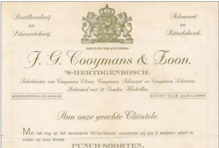
Afb. 4: prospectus uit 1912. Cooymans is intussen hofleverancier en laat dat graag weten aan zijn klanten.