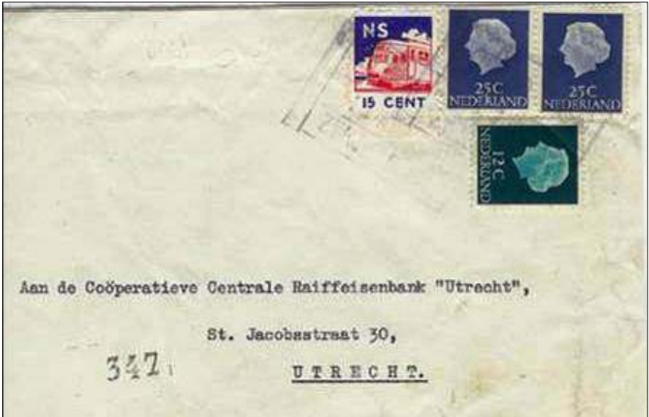
afb. 2 Brief verzonden per treinexpresse in de periode 1957-1964 (stempel is niet leesbaar) naar Utrecht. Treinzegel van 15 ct volgens het eerste na-oorlogse ontwerp. Posttarief van expresse verzending (brief 12 ct, expresse 50 ct).