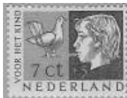
Nr. 614 met een grijze vlek bij de mond