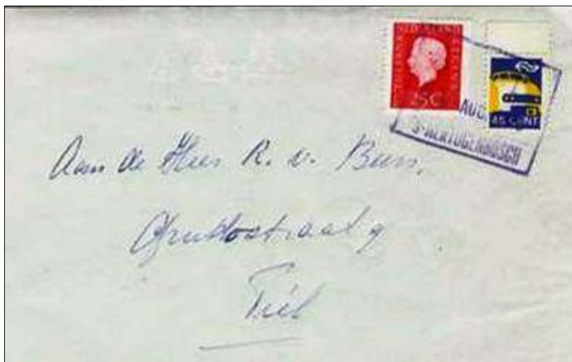
afb. 6 Brief verzonden van 's-Hertogenbosch naar Tiel (datumstempel niet leesbaar). Treinexpresse-zegel van 45 cent, ontwerp 1970.