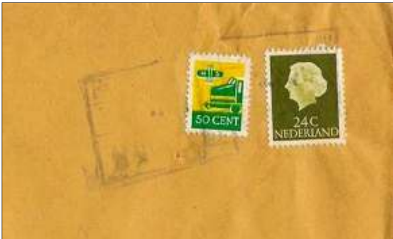
afb.3 Brief verzonden per treinexpresse in de periode 1 maart – 12 april 1964 (stempel is niet leesbaar). Treinzegel van 50 ct volgens het tweede na-oorlogse ontwerp. Posttarief voor een brief 2 e gewicht was tot 1 juli 1964 24 ct.