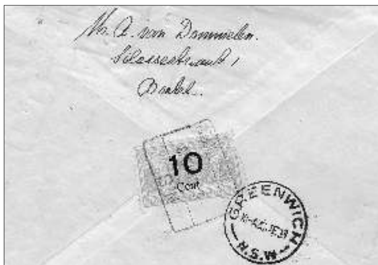
afb. 1 Voor- en achterzijde van een brief verzonden van Boxtel via 's-Hertogenbosch naar Australië op 5 juni 1938 per treinexpresse en luchtpost; aankomst op 10.6.38. Posttarief naar buitenland: 12,5 ct + 40 ct luchtrecht. Treinexpresse zegel van 10 cts.