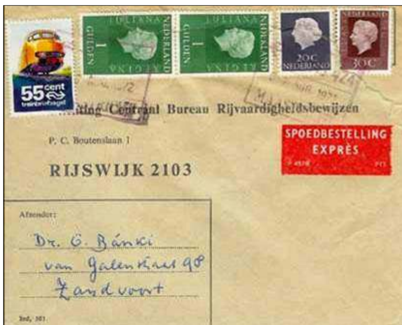
afb. 7 Brief als spoedbestelling en treinexpresse-brief verzonden naar Rijswijk in augustus 1972 (stempel niet geheel leesbaar). Treinzegel van 55 ct, ontwerp 1972. Brieftarief 2 e gew. 50 ct tot 1.9.72. Expressetarief 200 ct.