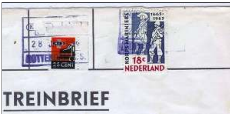
afb. 4 Treinbrief verzonden vanaf Rotterdam C.S. op 28 januari 1966. Tarief treinexpresse: 25 ct; brieftarief PTT: 18 ct.