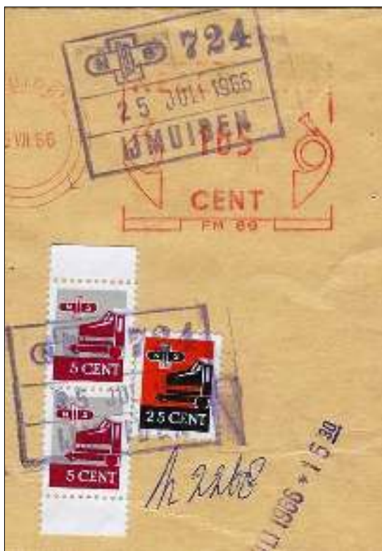
afb. 5 Treinbrief verzonden vanuit IJmuiden op 25 juli 1966. Tarief treinexpresse 35 ct. In afwachting van de zegel in de waarde van 35 ct gefrankeerd met een zegel van 25 ct, aangevuld met twee zegels van 5 ct.