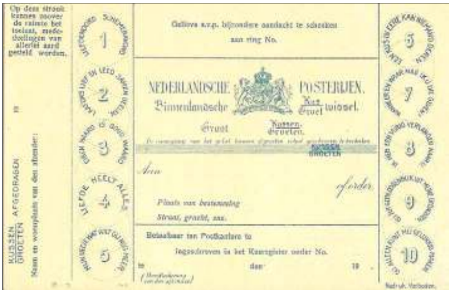
Afbeelding 6: prentbriefkaart als "Kus/Groetwissel" (ongebruikt)