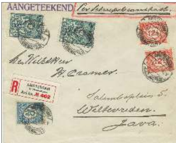
idem echter 2 e gewichtsklasse (25 cts afstandsrecht + 20 cts aantekenrecht + 2x 15 cts brandkastrecht)