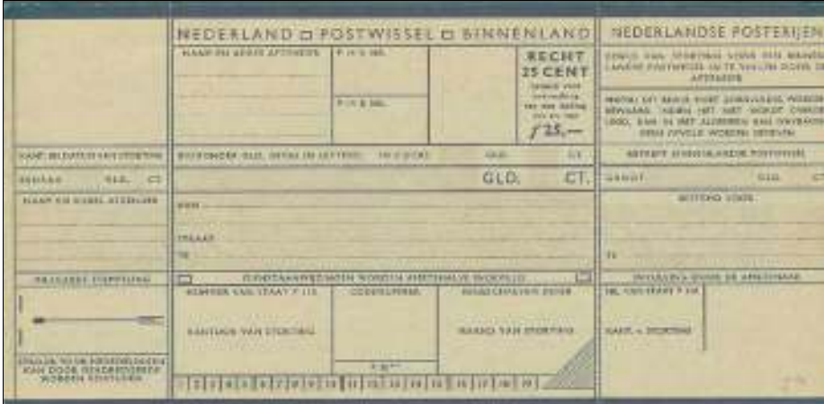
>Afbeelding 3: een postwisselformulier uit 1957, een postwaardestuk met een tekst die het betaalde recht aanduidt

In de loop der jaren zijn er in Nederland verschillende postwisselformulieren in gebruik geweest waarop de hoogte van het verschuldigde recht niet ingevuld hoefde te worden, maar al voorgedrukt was. Bij de prijs van deze formulieren was het recht al inbegrepen; deze formulieren behoren daardoor tot de postwaardestukken.