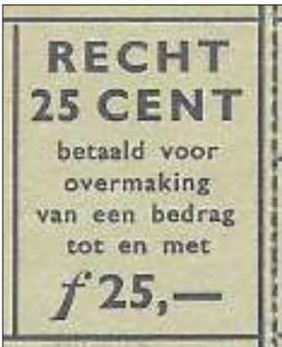
Afbeelding 3a: "RECHT 25 CENT betaald voor overmaking van een bedrag tot en met f 25,-"

Het mooiste exemplaar van deze postwissel-postwaardestukken is het formulier dat in 1924 gebruikt werd door het Provinciaal Waterleidingbedrijf van Noord-Holland. Het verschuldigde recht is op dit formulier namelijk niet met een tekst weergegeven, maar met een opgedrukte postzegel van 10 cent in het type-