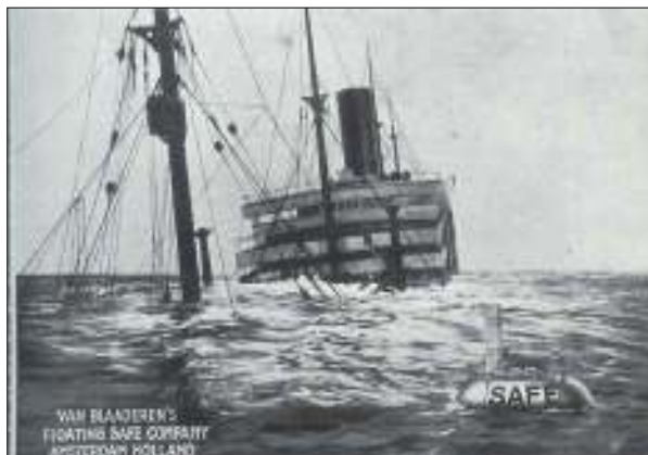
Advertentie voor vervoer per drijvende brandkast

Reden genoeg voor de PTT om per 1 september 1923 het gehele drijvende brandkast-gebeuren af te blazen.