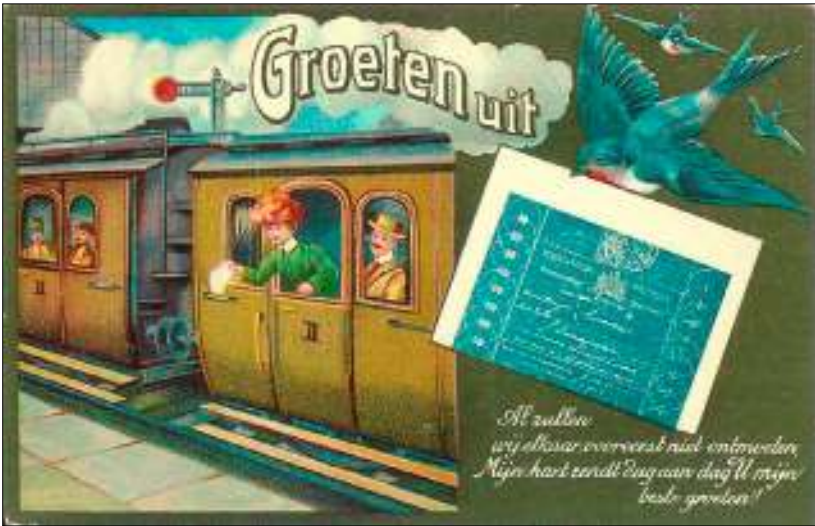
Afbeelding 8: ongebruikte kaart "Groeten uit ...". De vogel draagt een postwissel met "Duizend kussen"

Zo bezien biedt de postwissel curieuze verbinding van posthistorie en romantiek... Jac Spijkerman (overgenomen uit "Novioposta")