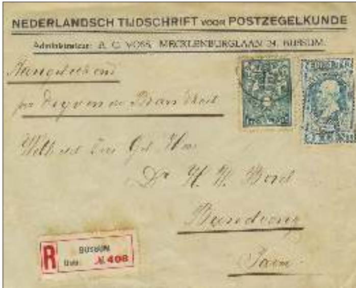
briefomslag 1 e gewichtsklasse t/m 20 gr. aangetekend per drijvende brandkast (10 cts afstandsrecht + 15 cts aantekenrecht + 15 cts brandkastrecht)