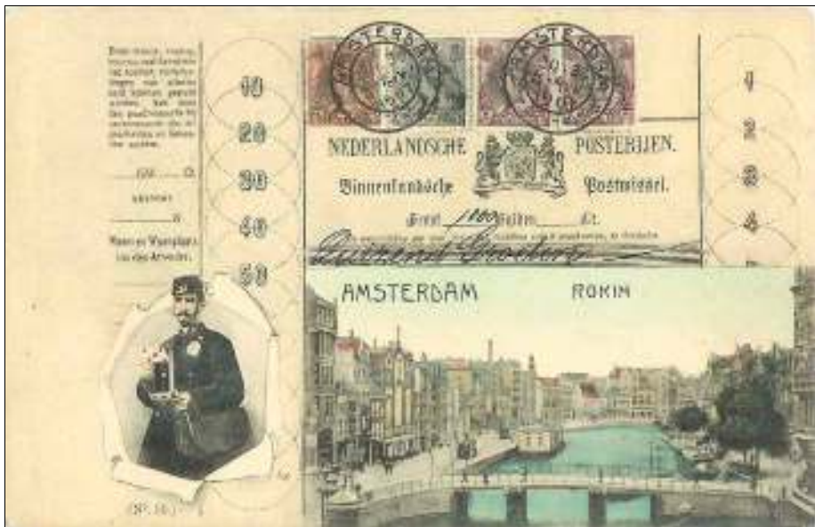
Afbeelding 7: prentbriefkaart met de afbeelding van een postwissel ter grootte van "Duizend groeten", een postbode en een stadsgezicht (de kaart is ongebruikt)