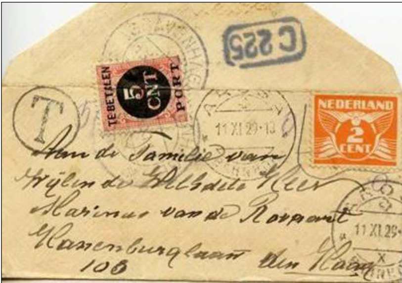
Arosa, 11 november 1929. Drukwerkenvelophe met bestemming Den Haag. De frankering in Zwitserland met een Nederlandse postzegel van 2 cent was uiteraard niet geldig. In 's-Gravenhage beport met het dubbele van het Nederlandse drukwerk tarief van 2 cent naar het buitenland, 4 cent. Afgerond op het eerste veelvoud van 5 cent. Bestellerstempel C 225 op achterklep. Formaat 11x5 cm.