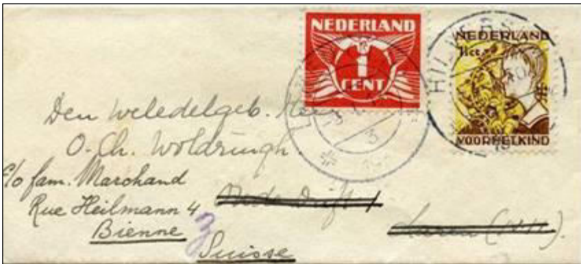
Hilversum, 7 januari 1933. Drukwerk-envelophe voor een visitekaartje verzonden tegen het drukwerk tarief naar Laren (N.H.). Tarief: drukwerk tot 50 gram 1½ cent. Doorgezonden vanuit Laren naar Bienne in Zwitserland met de noodzakelijke bijfrankering met 1 cent tot het internationale drukwerk tarief van 2½ cent. Formaat 11.5x5 cm.