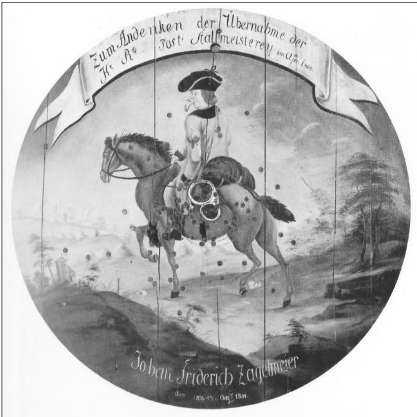
Ereschietschijf voor de post- en stalmeester Ziegelmeier (1801).