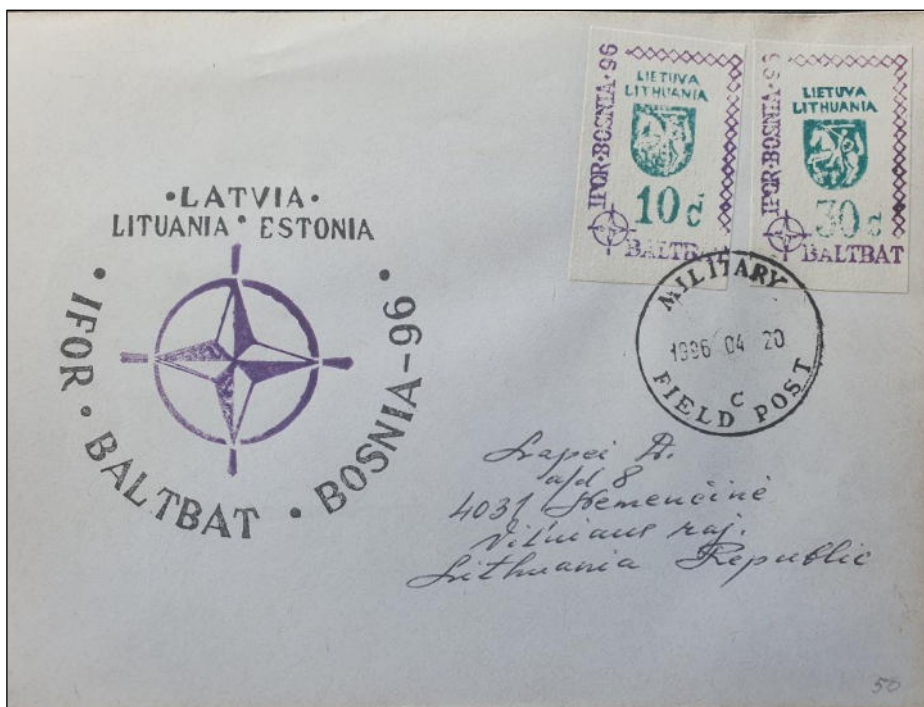
Een van de enveloppen