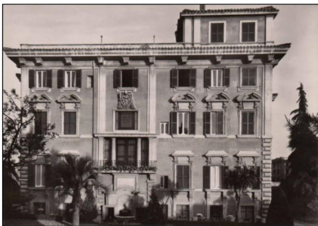
Pontificio Collegio Eclastico Olandese aan de Via Ercole Rosa 1 in Rome

De aangetekende brief (met aantekenstrookje Roma Ostiense 3281 en stempels aan voor- en achterzijde Roma Ostiense Accettazione Raccomandata ) is eerst gecontroleerd door de Italiaanse censuur (ronde stempel Censura Posta ) en daarna door Duitse censuur (stempelrand linkerzijde OKW en (d) en swastika). De censuurstrook zelf ontbreekt, maar de plakrand ervan is nog zichtbaar.