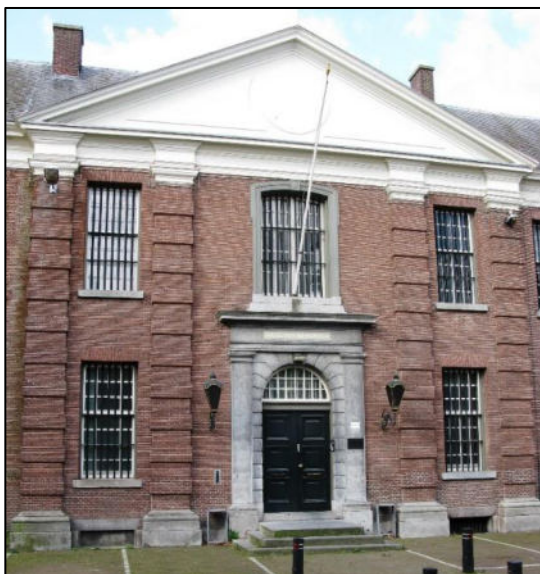
Façade van het Bossche Huis van Bewaring.