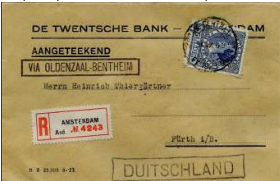
Amsterdam, 31 oktober 1928. Stevige brief met bestemming Fürth, Duitsland. Tarief: brief tot 20 gr: 15 ct; per 20 gr. meer: 10 ct. 140-160 gr. betekent 85 ct. Aantekenrecht: 15 ct. Totaal 1,00 gulden. Er zat iets zwaars in de envelop.