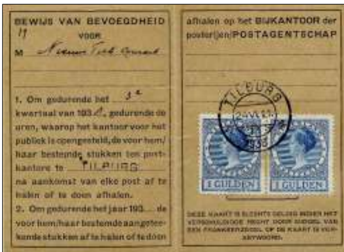
Tilburg, 24 juni 1938. Bewijs van bevoegdheid voor het afhalen van poststukken in het derde kwartaal van 1938.

Tarief: vanaf 1.1.1933 tot 1.4.1939: 2 gulden voor de groep 'overige kantoren'.