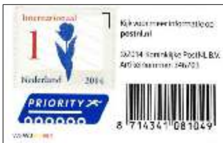
Velletje internationaal W3

Van het velletje met 10 Nederlandse iconen waarde 1 is nu ook een zwarte W3 verschenen. Ook hier is het webadres ingekort. Verder kan ik geen verschillen ontdekken in de zegels uit de W2 en de W3 versie. Wel is een klein kleurverschil te zien in de oranje balk in het tarievenlijstje op het velletje. Bij de W1 versie is dit balkje iets lichter van kleur dan bij de W2 en de W3 versies. Ook van de mailers met 50 zegels met de waarde internationaal is een versie verschenen met een verkort webadres.