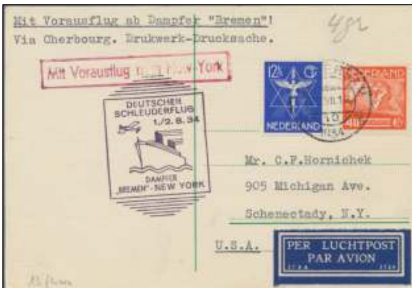
Afb. 3: Katapult drukwerk. Augustus 1934 van Rotterdam naar New York met de S.S Bremen.

Deutscher Schleuderflug / 1./2. 8. 34 / Dampfer "Bremen" - New York.