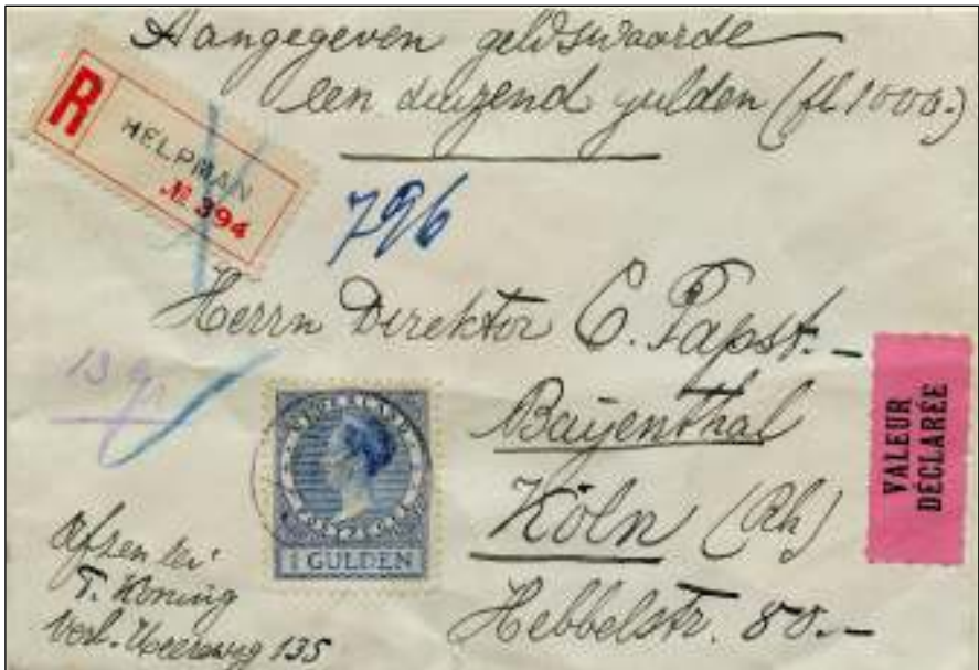
Helpman, 8 april 1926. Brief met waarde aangifte van 1.000 gulden naar Keulen. Tarief: brief van 13 gram: 15 ct; vast recht (aantekenrecht): 15 ct; variabel recht: 10 ct per 150 gld. 1.000 gulden betekent: 7 \times 10 \text{ ct} = 70 \text{ ct} . Totaal 1,00 gulden.