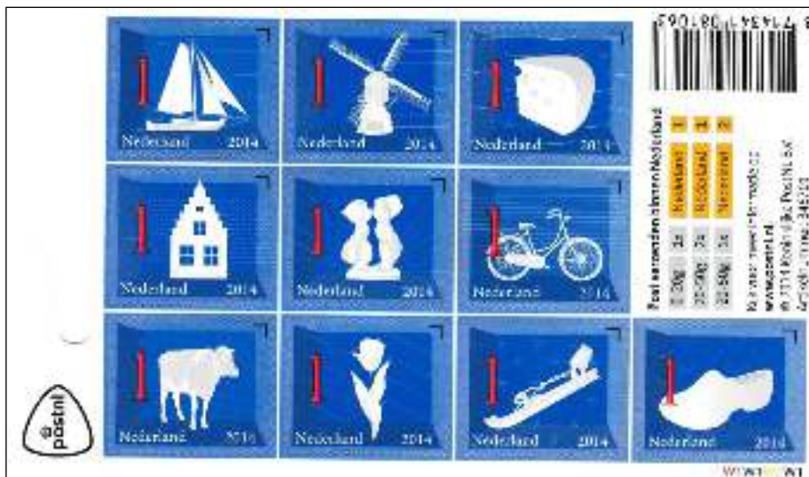
Nederlandse iconen W1