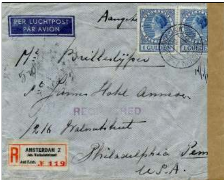
Amsterdam-Joh, Verhulststraat, 14 januari 1940. LP-brief met bestemming Philadelphia, USA. Tarief: brief 21-40 gr.: 20 ct; aantekenrecht: 10 ct; luchtrecht per 5 gr 27½ ct. 26-30 gr. betekent 6 x 27½ ct = 1,65 gld. Totaal 1,95. 5 ct teveel geplakt.

Tarief: vanaf 1.1.1933 tot 1.4.1939: 2 gulden voor de groep 'overige kantoren'.