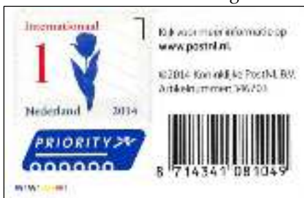
Velletje internationaal W1

Behalve de twee zakenpostzegels waar ik eerder een stukje over geschreven heb, zijn op 2 januari 2014 ook de Nederlandse iconen uitgegeven. Een velletje van 10 verschillende zegels met de waarde 1 en een velletje van 5 verschillende zegels met de waarde Internationaal. De zegel Internationaal met de afbeelding van een trapgevel is ook in mailers van 50 stuks uitgegeven. In de speciale catalogus 2018 van de NVPH staat bij het velletje internationaal een opmerking dat er ook een nieuwe uitgifte van het velletje met W2 is. Deze tweede druk is ontstaan doordat in augustus 2017 een nieuwe offsetrotatiepers is geïnstalleerd bij Walsall Security Printers. Ook van het velletje met 10x de waarde 1 is toen een tweede druk verschenen. Zie voor meer informatie Collect 96, zomer 2018 blz. 15. De zegels van deze tweede druk zijn volgens de drukker een stuk scherper. Kort geleden kreeg ik van Patrick Wessels een tip dat er nu ook een velletje internationaal is waarvan het zwart W3 is geworden. De overige kleuren zijn nog W2. Wat bij dit velletje opvalt is dat het webadres voor meer informatie, is ingekort van www.post.nl tot postnl.nl zonder www en zonder punt erachter. Lastiger te zien is, dat het lijkt of deze laatste druk geen offset meer is maar rasterdruk is geworden. Daardoor zijn niet alleen de velletjes anders maar ook de losse zegels.