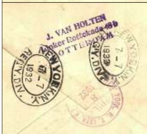
Afb. 1: Brief verstuurd 1 juli 1932 van Rotterdam naar New York via Cherbourg met de S.S. Bremen.

De verzendkosten naar de Verenigde Staten waren 12½ cent plus 15 cent aantekenen, voor een totaal van 27½ cent, betaald met een blauwe 12½ cent en een oranje-gele 15 cent 'Veth' postzegel.