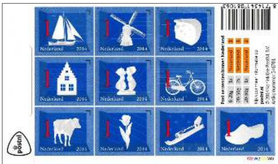
Nederlandse iconen W3