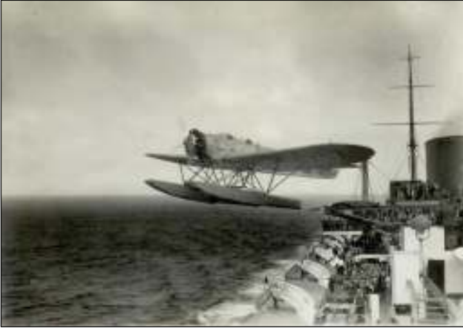
Afb. 2: Watervliegtuig gelanceerd vanaf de S.S. Bremen.

Toen de S.S. Bremen, die deze brief vervoerde, nog ongeveer 160 mijl uit de Amerikaanse kust was, werd met een soort katapult vanaf het dek een water-vliegtuig met post aan boord gelanceerd richting New York (afb. 2).