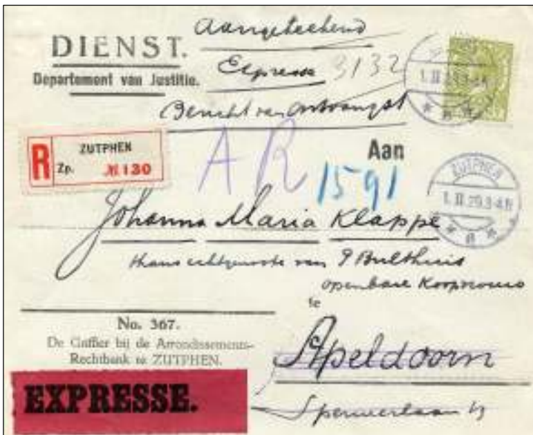
Zutphen, 1 februari 1929. Brief naar Apeldoorn. Tarief: brief en aantekenrecht portvrijdom. Expresrecht 10 cent. Met bericht van ontvangst (AR) 15 cent. Justitie gaat voor zekerheid! Op de achterzijde de aantekening dat de brief retour is gestuurd; geadresseerde vertrokken naar USA.