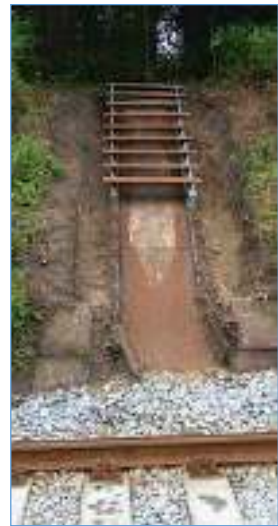
Het Trapje van Borski in Overveen.

Een tweede concessie die Borski bedwong was dat er geen 'drankgelegenheid' op het station mocht komen, maar sinds 1996 is er toch een restaurant (Klein Centraal) in het stationsgebouw.