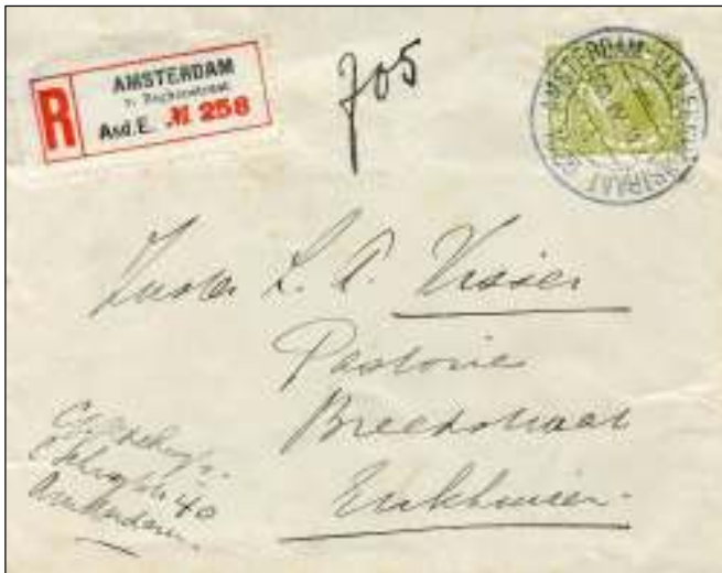
Amsterdam-van Eeghenstraat, 20 april 1925. Brief met bestemming Enkhuizen. Tarief: brief tot 20 gr 10 cent, aantekenrecht 15 cent.