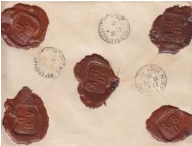
De achterzijde van de brief met lakstempels en de route- en aankomststempels.