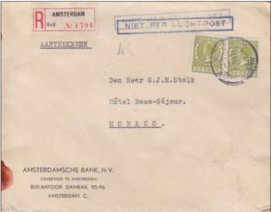
Amsterdam, 18 december 1936. Brief met bestemming Monaco. Tarief: brief 4 e gewichtsklasse, 61-80 gram, 35 cent; aantekenrecht 15 cent. Samen 50 cent. Stempel 'niet per luchtpost'.