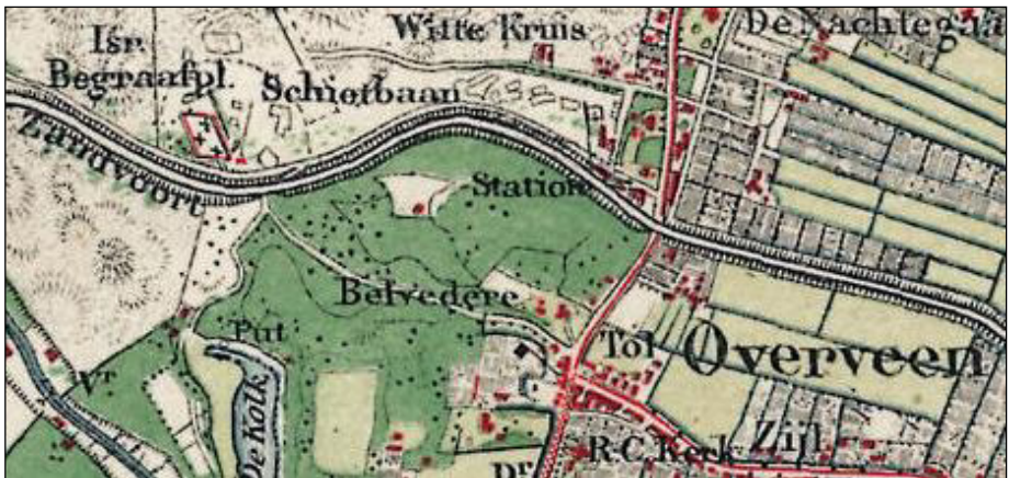
Topografische kaart met de bocht langs Belvedere in de spoorlijn Haarlem-Zandvoort.