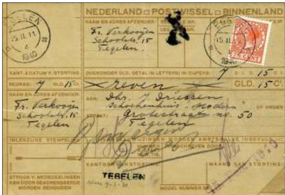
Tegelen, 15 februari 1940. Geweigerde, niet geïnde postwissel van 7,15 gulden. Tarief: van 5 gulden tot 12,50 gulden 7½ cent. Volgens een mededeling op de achterzijde betreft het een factuur waarvoor alleen bij contante betaling 10% korting mocht worden afgetrokken.