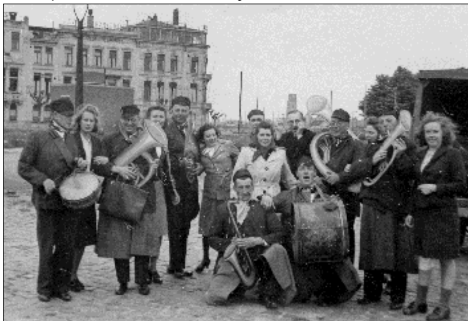
Afb. 1: Leden van het 's-Hertogenbosch Mannenkoor in het verwoeste Rotterdam vanwege de actie 'Den Bosch dankt Rotterdam', 1 juni 1946.

Voor een geboren en getogen Rotterdammer, maar die al bijna 40 jaar in Den Bosch woont, gaat er natuurlijk een extra lampje branden wanneer die twee steden met elkaar in verband kunnen worden gebracht. Dan is het aardig te weten dat Erasmus van Rotterdam in de 15 e eeuw naar school ging in 's-Hertogenbosch. En dat een eeuwlang de 'Rotterdamse boot' over het water beide steden dagelijks met elkaar verbond. Na het bombardement door de Duitsers in de meidagen van 1940 kwam 's-Hertogenbosch Rotterdam te hulp. En Rotterdam, op zijn beurt, verleende 's-Hertogenbosch hulp na de bevrijding in 1945. Tussen beide steden ontstond toen een speciale band, die door wederzijdse bezoeken werd onderstreept.