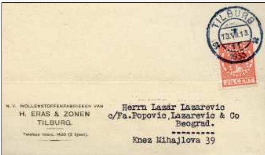
Tilburg, 13 juli 1933. Briefkaart met bestemming Beograd, Belgrado, nu Servië. Tarief: 7½ cent. Firmaperforatie E. Z. Eras & Zonen.