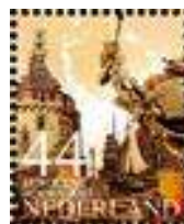
Michiel de Ruyter in Vlissingen en in Hoorn