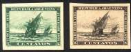
Afb. 2: kartonproeven van postzegels Argentinië van schepen Columbus

Op 29 september 1513 beklom een klein groepje Spanjaarden onder leiding van de conquistador en ontdekkingsreiziger Vasco Núñez de Balboa in het snikhete oerwoud van Panama een ruige bergtop, waaruit zij uitkeken op het zeegroene water van de Stille Oceaan, die hij “Zuidzee” noemde (afb. 3).