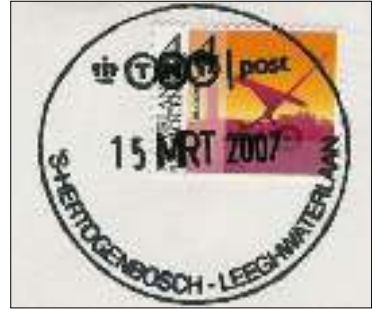
Afb. 2: Leeghwaterlaan