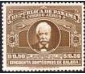
Afb. 7: Ferdinand de Lesseps

had gemaakt en in Frankrijk werd hij als een autoriteit beschouwd op velerlei gebied. Hij was op zoek naar een ander project dat zowel hem zelf als Frankrijk nog meer glorie zou opleveren. Daarbij viel zijn blik op Panama.