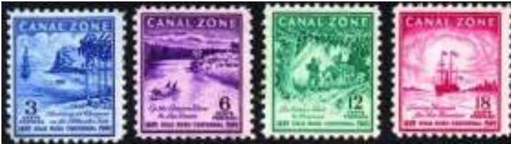
Afb. 5: de "Gold rush"- route

De Verenigde Staten kregen ook belangstelling voor de landengte, zeker toen er aanzienlijke hoeveelheden goud werden ontdekt. In 1849 was de "Gold rush" in volle gang. Duizenden Amerikanen probeerden op alle mogelijke manieren van de oostkust naar de westkust te trekken. De meest gebruikelijke route liep over Panama. Regelmatig voeren volgeladen schepen van de Amerikaanse naar de Panamese oostkust, vanwaar de goedzoekers op elke denkbare wijze naar de westkust trokken in de hoop daar op een schip naar "Frisco" te kunnen stappen. Om aan deze vraag te voldoen werd de Pacific Mail Steamship Company opgericht, die meerdere stoomschepen met elk een capaciteit van 800 passagiers in bedrijf had op de route Panama-Californië (afb. 5). Er was geen enkele vorm van georganiseerd vervoer tussen beide kusten. De goudzoekers moesten zelf maar zien hoe ze per muilezel, kano of te voet de Stille Oceaan bereikten.