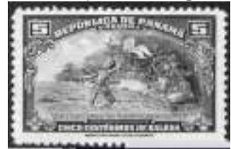
Afb. 3: Balboa bereikt de ‘Zuidzee’

Balboa begreep onmiddellijk het belang van zijn ontdekking: Panama vormde de verbinding tussen twee oceanen.