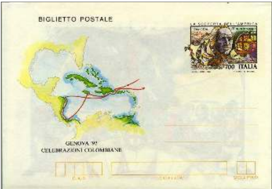
Afb. 1: postwaardestuk vierde reis Columbus langs kust Midden-Amerika

Tussen 1492 en 1504 maakte Christopher Columbus vanuit Spanje vier ontdekkingsreizen naar landen die hij later 'de nieuwe wereld' zou noemen. In 1502 kreeg Columbus toestemming voor een vierde reis. Hij ging op zoek naar een doorgang in Midden-Amerika om zo alsnog de weg naar Indië via de west te voltooien. Hijzelf geloofde nog steeds dat hij Oost-Azië had bereikt. De doorgang die hij zocht wordt beschreven door Marco Polo, en komt overeen met de straat Malakka, tussen Maleisië en Sumatra. Het spreekt vanzelf dat Columbus die doorgang niet vond. Hij bevoer de Midden-Amerikaanse kust van Kaap Gracias a Dios tot Panama.