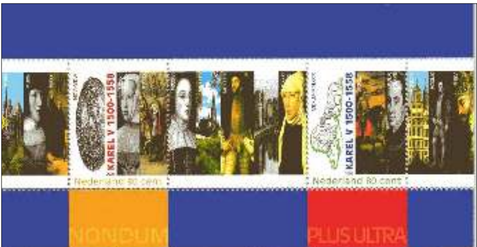
Afb. 4: Karel V

Het idee van een transcontinentaal kanaal dateerde van het begin van de koloniale periode. Al in de jaren dertig van de zestiende eeuw werd de Rio Chagres, die de landengte vanaf de Caraïbische kust over ongeveer driekwart van de breedte doorsneed, gebruikt voor het vervoeren van zware ladingen.