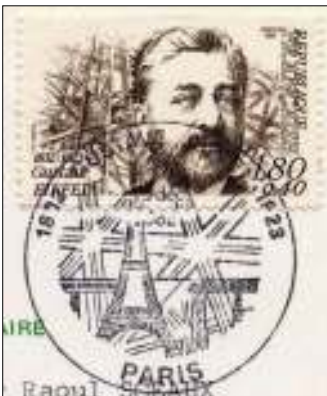
Afb. 9 : Gustaf Eiffel

gebruik van sluizen. Hij zag dit als tijdelijke oplossing, omdat de sluizen zo ontworpen waren dat ze, bij het vorderen van baggerwerkzaamheden, stuk voor stuk verwijderd konden worden. Gustaf Eiffel (afb. 9), op dat moment druk bezig met de toren in Parijs die nog zijn naam draagt, zou deze sluizen bouwen. Echter de beslissing om een kanaal met sluizen te bouwen kwam te laat om het Franse project te redden. De Compagnie Universelle du Canal Interocéanique ging in 1888 failliet (10).