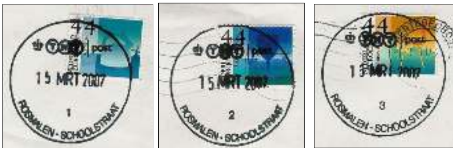
Afb. 5: Rosmalen Schoolstraat 1, 2 en 3

voor frankiemachinepost werden gedaan (afb. 5). De brief met stempelnummer 1 werd de volgende dag bezorgd, maar liet geen verdere stempeling of andere sporen van sortering zien. De brief met stempelnummer 3 arriveerde eveneens op 16 maart; deze droeg de PRIC, barcode én de machinale datumafstempeling. De brief met stempelnummer 2 deed er een week over. De machine stempelde hem pas af op 21 maart en op 22 maart werd hij bezorgd.