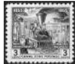
Afb. 6: trein van Panama Railroad Compagny

In 1848 richtte een aantal investeerders uit New York de Panama Railroad Company op om een spoorwegverbinding tussen de beide oceanen aan te leggen (afb. 6). In 1850 begon het werk aan de Caraïbische kust (de huidige stad Colón, genoemd naar Columbus) en duurde tot 1855. De spoorlijn volgde bijna hetzelfde traject als het latere kanaal. Aangezien een spoorweg onmisbaar was bij elk denkbaar kanaalproject, lag de Panama Railroad ten grondslag aan de komende bouwactiviteiten.