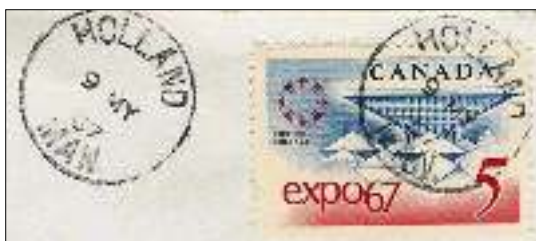
Afb. 4: stempel HOLLAND MAN(ITOBA) in Canada