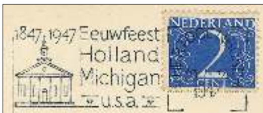
Afb. 1: vlagstempel 1947

Bovenstaand berichtje stond op 19 maart j.l. in het Brabants Dagblad. Het herinnerde me aan een bekend vlagstempel uit 1947, waarvan ik eigenlijk nooit de achtergrond had begrepen (afb. 1).