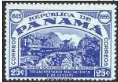
Afb. 8: graafwerkzaamheden