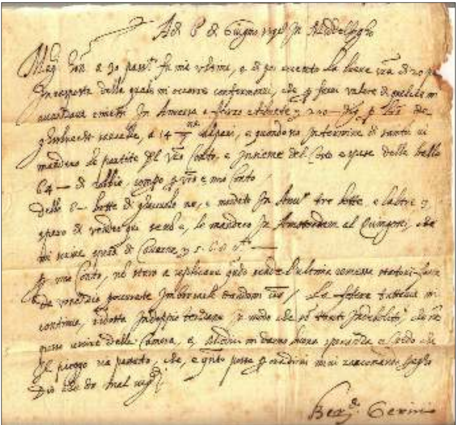
Afb. 3: inhoud van de Corsini-brief

De brief is geschreven in het Italiaans. De onderstaande afbeelding toont de inhoud ervan.