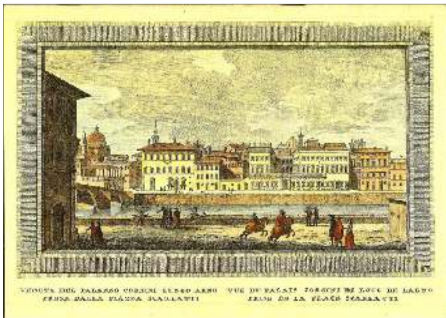
Afb. 1: het Florentijnse palazzo waarin het handelshuis Corsini in Italië was gevestigd