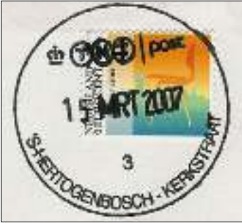
Afb. 1: Kerkstraat 3