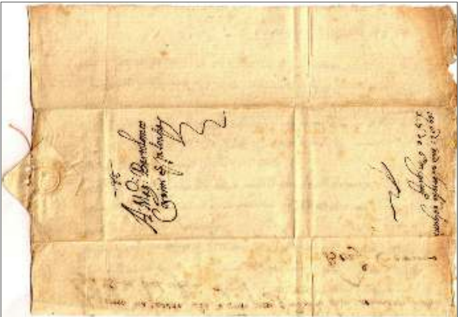
Afb. 2: voor-(links) en achterkant van de Corsini-vouwbrief

De volgende afbeelding is de adreszijde van een in mijn bezit zijnde brief uit het Corsini-archief en kopstaand de achterkant van de vouwbrief.