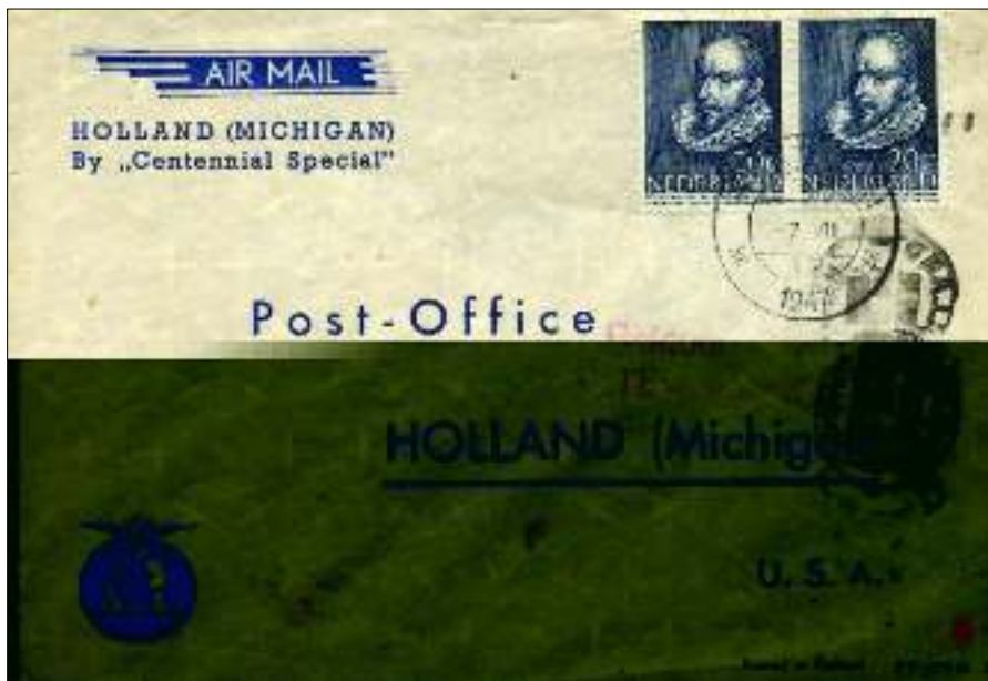
Afb. 3: KLM-vlucht 'Centennial Special' en aankomststempel (op achterzijde) HOLLAND MICH. 18 AUG 1947