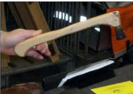
Afb. 3: hamerstempel bij het Geerke

Op de drie businesscentra (Plevierstraat, West Point en Geerke) werkte men