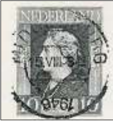
Afb. 9 Kortebalk Middelburg met het jaartal ondersteboven