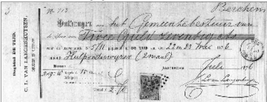
De bewuste kwitantie/zoekplaat

Welke 'speurneus' voelt zich aangesproken? Reacties graag naar het secretariaat van de vereniging.