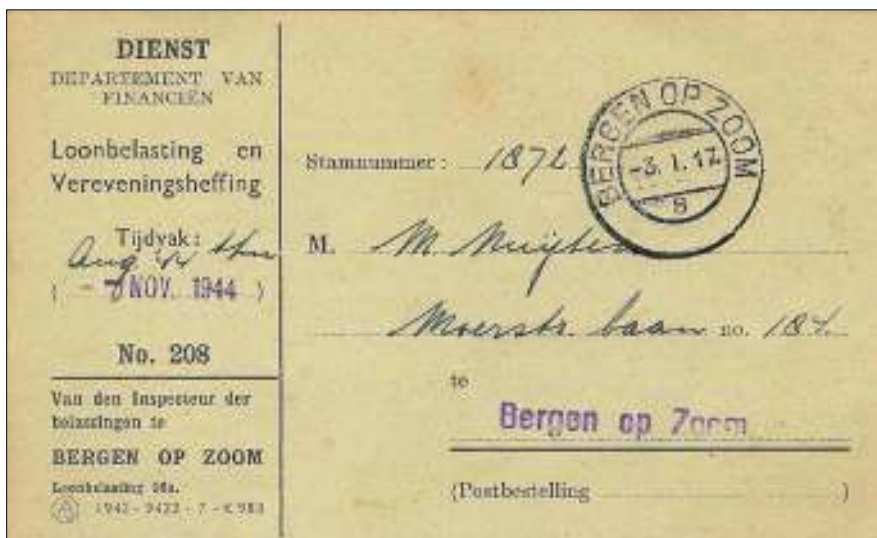
Afb. 1 Dienstbrief op 3 januari 1945 verzonden uit Bergen op Zoom; stempel zonder jaarkarakter

Aanvankelijk moest de stempeling van de correspondentie in januari 1945 geschieden zonder jaartal (afb. 1). In sommige gevallen werd het jaartal met inkt bijgeschreven.