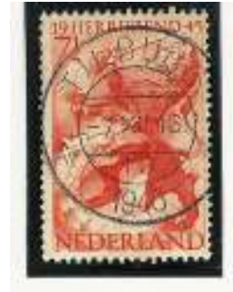
Afb. 5 Het nieuwe Tilburg 10 met gesloten vier in jaartal 1945

Uit bestaande afdrucken van de beide stempel Exemplaren is op te maken dat de wisseling heeft plaatsgevonden tussen 18 juli en 14 november 1945. Een nieuw stempel werd immers pas afgeleverd nadat het oude stempel met hetzelfde nummer was ingeleverd.