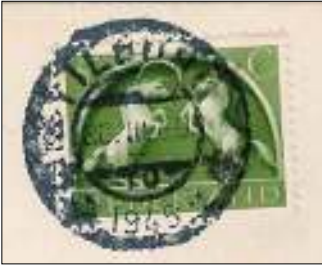
Afb. 4 Tilburg 10 met noodjaarkarakter