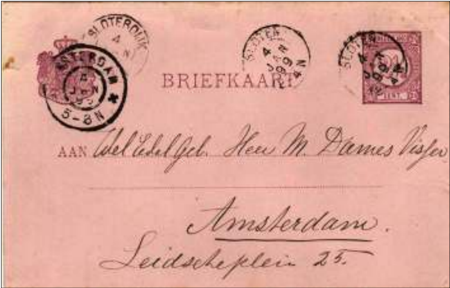
Briefkaart op 4 januari 1899 verzonden van Sloten naar Amsterdam

Wat was het geval? Aan de West- en Zuidwestkant van de gemeente Amsterdam lag de gemeente Sloten, met een groot oppervlak en weinig bevolking. Amsterdam maakte eind 19 de en begin 20 ste eeuw een enorme bevolkingsgroei door en aasde met succes naar uitbreiding van haar oppervlak. In 1921 werd het gehele grondgebied van Sloten aan Amsterdam toegevoegd. Sindsdien bestaan er poststukken voorzien van een grootrodstempel met bijvoorbeeld aanduiding Slooten.