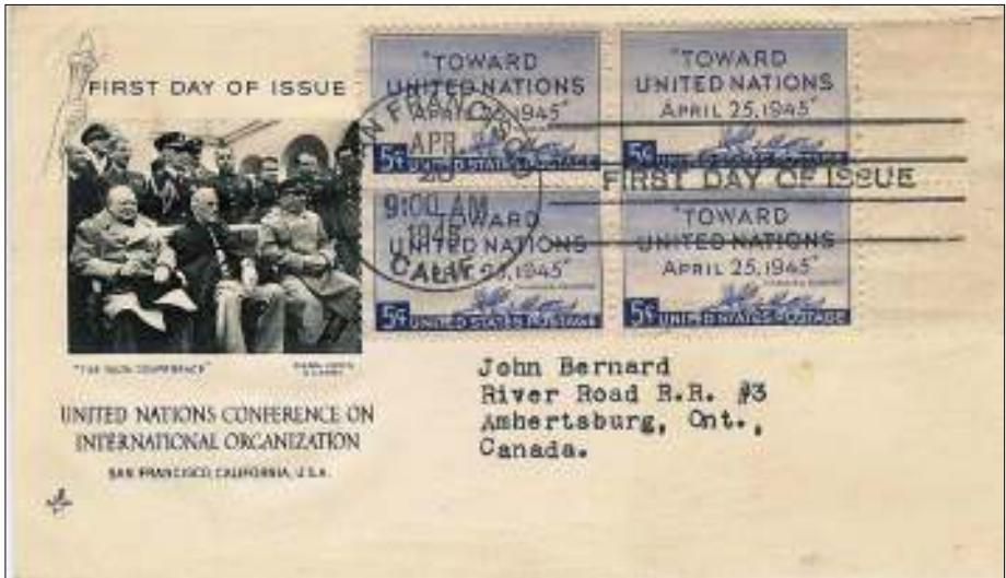
Afb. 10 Postzegel met open, stempel met gesloten vier