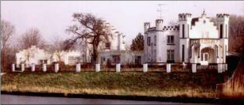
Kasteel Meerwijk te Empel aan rivier de Dieze