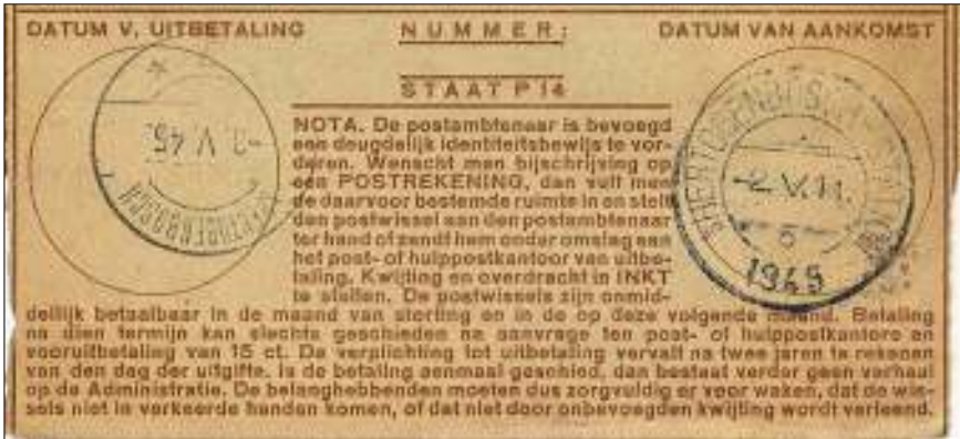
Afb. 2 Links lange balk met gesloten en rechts korte balk met open vier

Voor de langebalkstempels was deze noodgreep niet nodig: in de langebalk was immers de gehele datum verstelbaar, zowel de dag als de maand en het jaar. Dit is mooi te zien aan de hand van een postwissel waarop de datum van aankomst op 's-Hertogenbosch Station met kortebalkstempel nr. 5 is aangegeven en de datum van uitbetalen op het postkantoor in het centrum van 's-Hertogenbosch met een langebalkstempel (afb. 2).