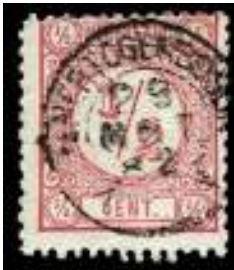
de Bossche tanding

Voor de goede orde: de zegel is absoluut in goede conditie.