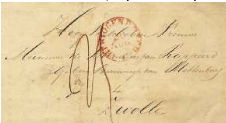
Adreszijde van de rouwbrief. Stempel K. 29, 's-Hertogenbosch 20 AUG.