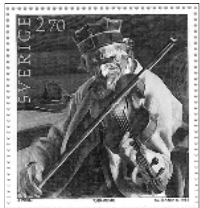
Oude speelman, Zweden 1983

In 1974 benoemde de Zweedse koning Gustav Adolf VI hem tot hofgraveur. Czeslaw Slania bleef werkzaam tot op het eind van zijn leven. Zijn laatste voltooide postzegel was die t.g.v. 60 jaar Verenigde Naties in februari 2005. Enkele staaltjes van zijn kunnen: