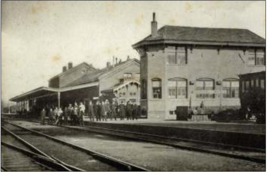
Station Boxtel, waar de NBDS de mailtreinen naar en van Vlissingen van het StaatsSpoor overnam. Rechts de kopsporen van de NBDS met de aanduiding Boxtel-Wesel.