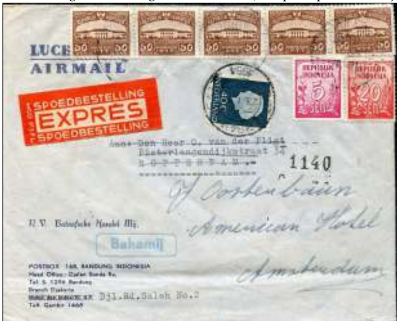
Djakarta, 18 januari 1954. Luchtpostbrief met bestemming Rotterdam. Frankering 2,75 Rupiah. In Rotterdam op 23 januari 1954 doorgestuurd naar Amsterdam tegen het expresrecht van 40 cent.