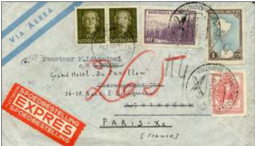
Buenos Aires, 1 augustus 1952. Luchtpostbriefje met bestemming Amsterdam. Frankering 1,45 Peso. In Amsterdam op 5 augustus 1952 per expresse doorgestuurd naar Parijs: expresrecht 30 cent. In Parijs bezorgd via buizenpost nummer 114, 6 augustus 's-morgens om 7.20 uur (stempels op de achterzijde).