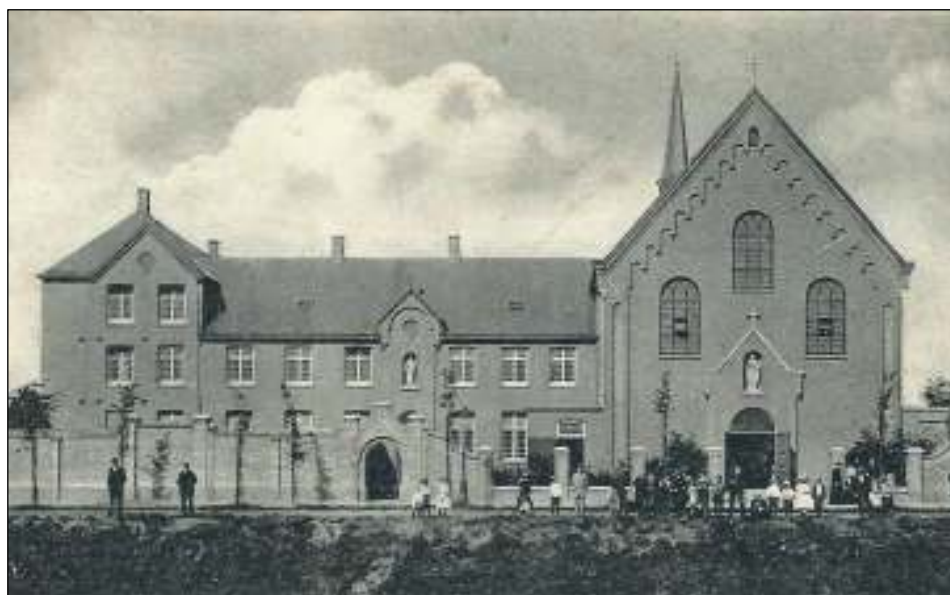
Het Kapucijnenklooster aan de v. d. Does de Willeboissingel kort na de voltooiing.