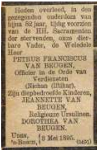
Rouwadvertentie in De Tijd van 7 mei 1895.