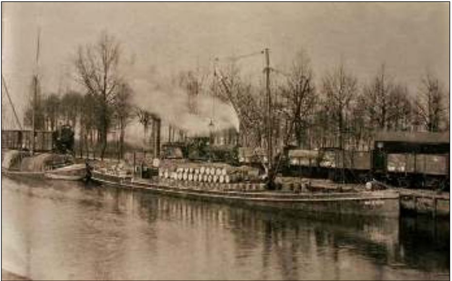
De haven van Veghel, waar de NBDS goederen van het spoor naar de eigen bootdienst oversloeg.